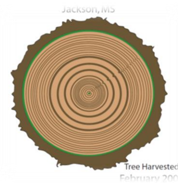
Σχήμα 6: Ψηφιοποιημένο δείγμα από τη βιβλιοθήκη της NASA