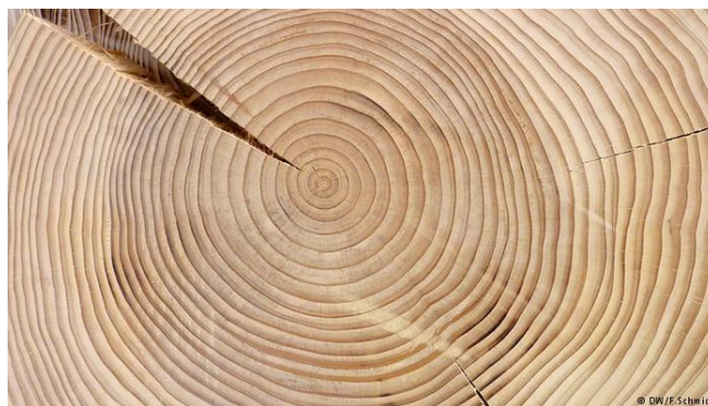
Σχήμα 1: Οι ετήσιοι αυξητικοί δακτύλιοι των δένδρων, εκτός από την ηλικία τους, καταμαρτυρούν τις καιρικές συνθήκες κατά την ανάπτυξή τους

Οι ετήσιοι δακτύλιοι των δένδρων που φύονται σε εύκρατα κλίματα, όπου παρατηρούνται εποχικές αλλαγές των κλιματικών συνθηκών, αποτελούνται από δύο ευδιάκριτες περιοχές: την ανοιχτόχρωμη ζώνη του πρώιμου εαρινού ξύλου και τη σκουρόχρωμη ζώνη του όψιμου θερινού ξύλου. Οι ζώνες αυτές διαφέρουν μεταξύ τους όχι μόνο στο χρωματισμό αλλά και την πυκνότητα. Το πρώιμο ξύλο αποτελείται από κύτταρα ευμεγέθη και με λεπτό τοίχωμα ενώ τα κύτταρα του όψιμου, συμπαγούς ξύλου είναι μικρότερα και έχουν παχύ κυτταρικό τοίχωμα.