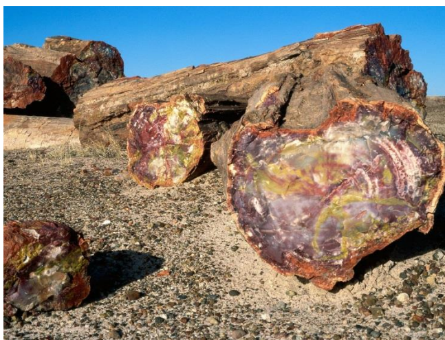
Σχήμα 2: Η διαδικασία της απολιθωσης του δάσους ήταν τόσο βίαιη που στα περισσότερα δείγματα είναι ευδιάκριτοι οι αυξητικοί δακτύλιοι των δένδρων

Από τις ερευνητικές εργασίες του Μουσείου Φυσικής Ιστορίας Απολιθωμένου δάσους Λέσβου τα τελευταία δέκα χρόνια στη περιοχή του Απολιθωμένου Δάσους Λέσβου έχουν αποκαλυφθεί διαφορετικές ζώνες βλάστησης, συνθέτοντας έτσι την εικόνα της βλάστησης που επικρατούσε στην περιοχή πριν από 20 εκατομμύρια χρόνια.