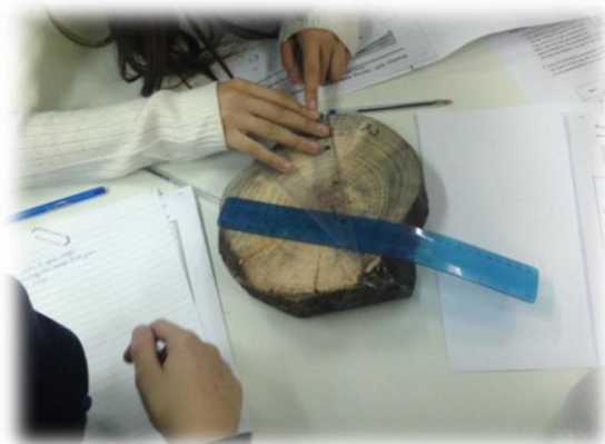
Σχήμα 3: Μέτρηση εύρους δακτυλίων

Στη συνέχεια, οι μαθητές και οι μαθήτριες εφοδιασμένοι με το αναγκαίο θεωρητικό υπόβαθρο προχώρησαν στην εφαρμογή της τεχνικής της δενδροχρονολόγησης. Σε αυτό το στάδιο, δόθηκαν στις μαθητικές ομάδες (ανομοιογενείς ως προς το φύλο και το γνωστικό επίπεδο) δείγματα κορμών που προέρχονταν από άγνωστες στα μέλη των ομάδων περιοχές προκειμένου μέσω της μέτρησης των αυξητικών δακτυλίων και τη δημιουργία κλιματικών αρχείων να προσδιορίσουν πιθανές περιοχές προέλευσης. Ακολούθως, η διαδικασία επαναλήφθηκε με ψηφιακά δείγματα προερχόμενα από το αρχείο της NASA (ΗΠΑ) (από το Μισισσίπι: διαθέσιμο στην ηλεκτρονική διεύθυνση: https://mydasdata.larc.nasa.gov/docs/Jackson_Tree_Ring.pdf/ , το Μιζούρι: https://mydasdata.larc.nasa.gov/docs/Columbia_Tree_Ring.pdf/ , τη Μασσαχουσέτη: https://mydasdata.larc.nasa.gov/docs/Boston_Tree_Ring.pdf/ και την Ουάσινγκτον: https://mydasdata.larc.nasa.gov/docs/Seattle_Tree_Ring.pdf/ ) καθώς και ψηφιοποιημένα δείγματα τα οποία δημιουργήθηκαν και εστάλησαν από το Μουσείο Φυσικής Ιστορίας Απολιθωμένου Δάσους Λέσβου κατόπιν δικού μας αιτήματος σε συνεργασία με την Υπεύθυνη του Τμήματος Εκπαιδευτικών Προγραμμάτων κα Μπεντάνα.