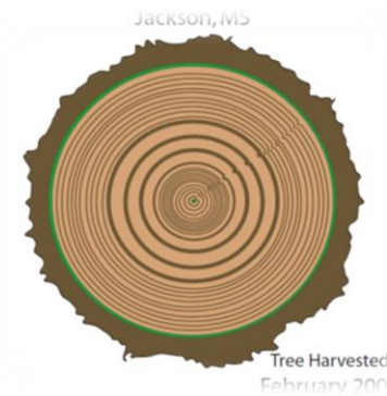
Σχήμα 6: Ψηφιοποιημένο δείγμα από τη βιβλιοθήκη της NASA