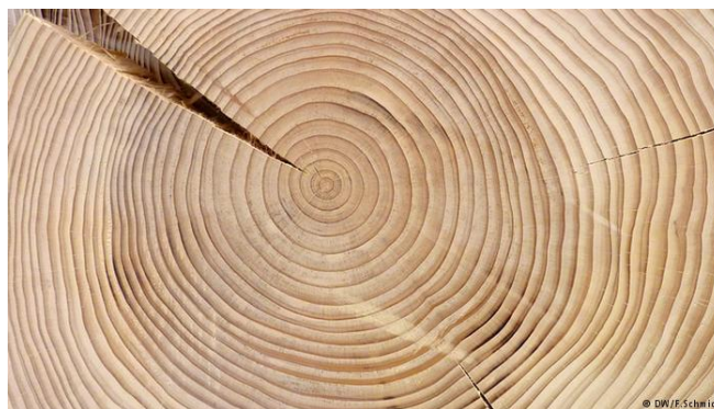
Σχήμα 1: Οι ετήσιοι αυξητικοί δακτύλιοι των δένδρων, εκτός από την ηλικία τους, καταμαρτυρούν τις καιρικές συνθήκες κατά την ανάπτυξή τους

Οι ετήσιοι δακτύλιοι των δένδρων που φύονται σε εύκρατα κλίματα, όπου παρατηρούνται εποχικές αλλαγές των κλιματικών συνθηκών, αποτελούνται από δύο ευδιάκριτες περιοχές: την ανοιχτόχρωμη ζώνη του πρώιμου εαρινού ξύλου και τη σκουρόχρωμη ζώνη του όψιμου θερινού ξύλου. Οι ζώνες αυτές διαφέρουν μεταξύ τους όχι μόνο στο χρωματισμό αλλά και την πυκνότητα. Το πρώιμο ξύλο αποτελείται από κύτταρα ευμεγέθη και με λεπτό τοίχωμα ενώ τα κύτταρα του όψιμου, συμπαγούς ξύλου είναι μικρότερα και έχουν παχύ κυτταρικό τοίχωμα.