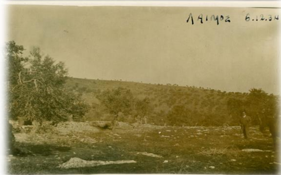
Εικόνα 1. Παραδοσιακός ελαιώνας του 1934

Οι περισσότεροι Μυτιληνιοί έχουμε μεγαλώσει και ανδρωθεί μέσα στους ελαιώνες που κυριαρχούν ως οικοσύστημα στη Λέσβο.