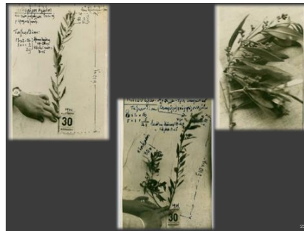
Εικόνα 5. Μελέτες Μίτσα Κουρτζή, ταξιανθιών ελιάς

Όσον αφορά στη λίπανση, όπως φαίνεται σε σημειώσεις που βρέθηκαν στο αρχείο του, προτείνει συγκεκριμένες μεθόδους που αφορούν στον τρόπο σκαψίματος γύρω από το δένδρο περιμετρικά, στο βάθος και στην απόσταση από το δένδρο, καθώς επίσης, και στον τρόπο λίπανσης των πεδινών και ορεινών ελαιοδένδρων.