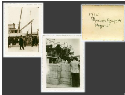
Εικόνα 9. Φορτίο λαδιού και σαπουνιού προς το εξωτερικό.

Το εμπόριο του λαδιού της Μυτιλήνης εξαπλώθηκε σε όλη την Ελλάδα στις χώρες της Μεσογείου, κι έφτασαν με τα πλοία της οικογενείας Κουρτζή μέχρι τη Λατινική Αμερική. Το λεσβιακό λάδι που μέχρι τότε ήταν χαρακτηρισμένο ως χαμηλής ποιότητας, γίνεται ανταγωνιστικό των ευρωπαϊκών λαδιών όπως των ιταλικών, ισπανικών και γαλλικών. Τέλος, ο ίδιος επιχειρηματίας είχε δημιουργήσει και σαπυνοποιεία με πολύ καλής ποιότητας σαπούνια διαφόρων ειδών και ποιοτήτων.