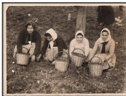
Εικόνα 2. Παραδοσιακές μαζώχτρες Μυτιληνιές

Ο παραγωγός της Μυτιλήνης μπορεί στο διάβα του χρόνου να ακολούθησε τις νέες εξελίξεις στον τομέα της καλλιέργειας της ελιάς, δεν αποκόπηκε όμως, ποτέ από την παράδοση. Αυτή αποτέλεσε την ακένωτη δεξαμενή ιδεών και καινοτομιών.