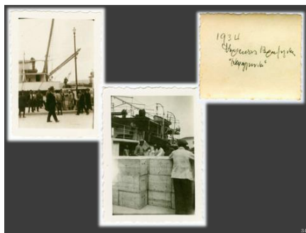
Εικόνα 9. Φορτίο λαδιού και σαπουνιού προς το εξωτερικό.

Το εμπόριο του λαδιού της Μυτιλήνης εξαπλώθηκε σε όλη την Ελλάδα στις χώρες της Μεσογείου, κι έφτασαν με τα πλοία της οικογενείας Κουρτζή μέχρι τη Λατινική Αμερική. Το λεσβιακό λάδι που μέχρι τότε ήταν χαρακτηρισμένο ως χαμηλής ποιότητας, γίνεται ανταγωνιστικό των ευρωπαϊκών λαδιών όπως των ιταλικών, ισπανικών και γαλλικών. Τέλος, ο ίδιος επιχειρηματίας είχε δημιουργήσει και σαπυνοποιεία με πολύ καλής ποιότητας σαπούνια διαφόρων ειδών και ποιοτήτων.