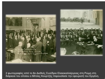
Εικόνα 8. Παρουσίαση μηχανής ελαιοσυγκομιδής σε συνέδριο στη Ρώμη

Στη συνέχεια την παρουσίασε στην Ευρώπη σε παγκόσμια συνέδρια των Παρισίων και της Ρώμης, και κατάφερε να τη διοχετεύσει στην αγορά της Ελλάδος και της Ευρώπης κάνοντας γνωστή τη μυτιληνιά πατέντα σε όλο το κόσμο. Απόδειξη της ευρύτατης απήχησης της καινοτομίας αυτής ήταν η παραγγελία από την Τράπεζα Αθηνών 200 μηχανημάτων για επίδειξη σε όλες τις ελαιοπαραγωγικές περιοχές τη Ελλάδα. Στην λογική των καινοτομιών του εμπίπτει και ένας νέος τύπος πλυντηρίου για τις ελιές εξαιρετικής χρηστικότητας.