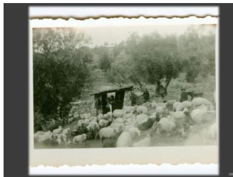
Εικόνα 10. Κτηνοτροφική μονάδα μέσα σε ελαιώνα Κουρτζή

που, καταναλώνοντας τα φύλλα της ελιάς και τα χόρτα που προέκυπταν από την επιπλέον λίπανση, απέφευγε την απομύζηση των θρεπτικών συστατικών από την ανεπιθύμητη βλάστηση, παράγοντας γαλακτοκομικά προϊόντα υψίστης ποιότητας. Επίσης, ανέπτυξε την ορνιθοτροφία, αφού εκτός του ότι τα πουλερικά του κατανάλωναν όλα τα υπολείμματα, εξολόθρευαν και τα έντομα και σκουλήκια που παρασιτούσαν στα δένδρα. Πολύ σημαντική υπήρξε εξάλλου, και η επεξεργασία και χρήση των φύλλων της ελιάς ως φάρμακο, λίπασμα και ζωοτροφή. Εφήρμοσε δηλαδή, μια ολιστική δυναμική καλλιέργεια.