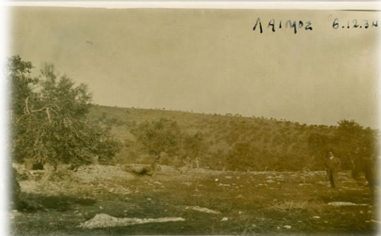
Εικόνα 1. Παραδοσιακός ελαιώνας του 1934

Οι περισσότεροι Μυτιληνιοί έχουμε μεγαλώσει και ανδρωθεί μέσα στους ελαιώνες που κυριαρχούν ως οικοσύστημα στη Λέσβο.