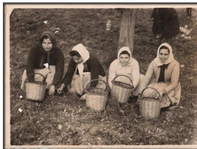
Εικόνα 2. Παραδοσιακές μαζώχτρες Μυτιληνιές

Ο παραγωγός της Μυτιλήνης μπορεί στο διάβα του χρόνου να ακολούθησε τις νέες εξελίξεις στον τομέα της καλλιέργειας της ελιάς, δεν αποκόπηκε όμως, ποτέ από την παράδοση. Αυτή αποτέλεσε την ακένωτη δεξαμενή ιδεών και καινοτομιών.