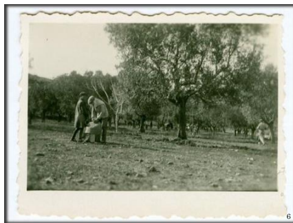
Εικόνα 4. Ελαιώνας της οικογένειας Κουρτζή.

και καρποφορίας, κάτι που συναντάμε στα σημερινά βιβλία της περιβαλλοντολογίας .