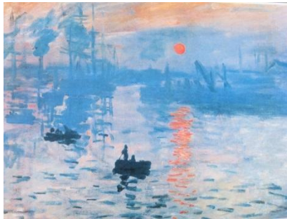
Εικόνα 2: Impression: Soleil Levant, C.Monet σε ηλιακό φως

Εκθέτουμε τον πίνακα σε φυσικό ηλιακό φως και παρατηρούμε τα χρώματά του.