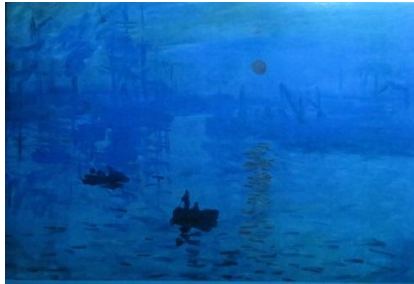
Εικόνα 5: Ο πίνακας εκτεθειμένος σε μπλε φως.

Ομοίως, εκθέτουμε τον πίνακα σε μπλε φως.