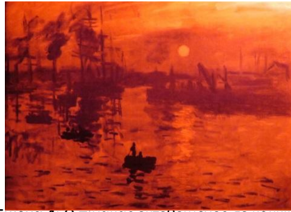
Εικόνα 4: Ο πίνακας εκτεθειμένος σε κοκκίνο φως.