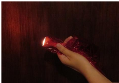
Εικόνα 3: Φακός καλυμμένος με κόκκινο σελοφάν

Σε σκοτεινό δωμάτιο, εκθέτουμε τον πίνακα σε κόκκινο φως, χρησιμοποιώντας τον φακό καλυμμένο με το κόκκινο σελοφάν.