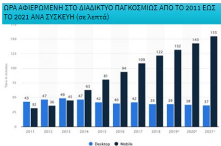
Διάγραμμα 1: Χρόνος στο διαδίκτυο από το 2011 έως το 2021.

συνεχώς συνδεδεμένοι στο διαδίκτυο, έχει παρουσιασθεί το αίσθημα του «FOMO» ή αλλιώς "fear of missing out," ένα φαινόμενο που γίνεται όλο και πιο συχνό και μπορεί να προκαλέσει αξιοσημείωτο άγχος στην ζωή του ανθρώπου που το βιώνει.