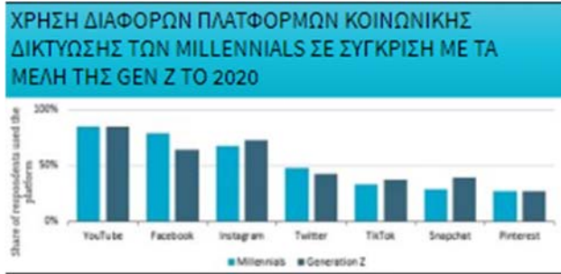
Διάγραμμα 2: Πλατφόρμες κοινωνικής δικτύωσης