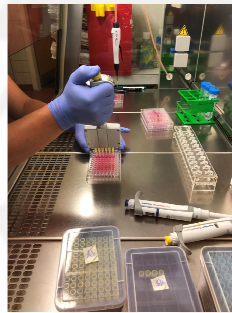
Abb. 1: Aussäen der Caco-2 Zellen.

Bei den Toxizitätstests wurde ein CTB Test und Neutralrot Test durchgeführt. Für beide Methoden wurden die Caco-2 Zellen in eine 96-well Platte ausgesät (Abb. 1). Die Zellen wurden dann mit den Azofarbstoffen in An- und Abwesenheit von Titandioxidnanopartikeln inkubiert und im Anschluss die Toxizitätsbestimmung durchgeführt (Abb. 2).