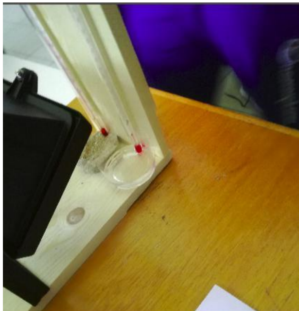
Εικόνα 3: Μέτρηση θερμοκρασίας σε άμμο και νερό. Ζεσταίνουμε τα δοχεία με μια λάμπα.

Έπειτα μελετήσαμε γραφικές παραστάσεις από την Εθνική Διοίκηση των Ωκεανών και της Ατμόσφαιρας των Ηνωμένων Πολιτειών Αμερικής 9 της μέσης επιφανειακής θερμοκρασίας της θάλασσας για τα έτη 1880 μέχρι 2015 και είναι εμφανής μια αυξητική τάση της θερμοκρασίας από τα έτη 1980 και μετά. Στην έκτη δραστηριότητα 2 βάλουμε ποσότητες άμμου και νερού σε δύο μικρά δοχεία και τοποθετήσαμε μια λάμπα να ώστε να ζεσταίνονται ταυτόχρονα τις ποσότητες αυτές (Εικόνα 3). Δημιουργήσαμε τις γραφικές παραστάσεις της θερμοκρασίας του νερού και της άμμου συναρτήσει του χρόνου και διαπιστώσαμε ότι η άμμος θερμαίνεται περισσότερο και γρηγορότερα από ότι το νερό. Το νερό αντιδρά πιο αργά λόγω της μεγάλης θερμοχωρητικότητάς του όπως είδαμε και στην πέμπτη δραστηριότητα.