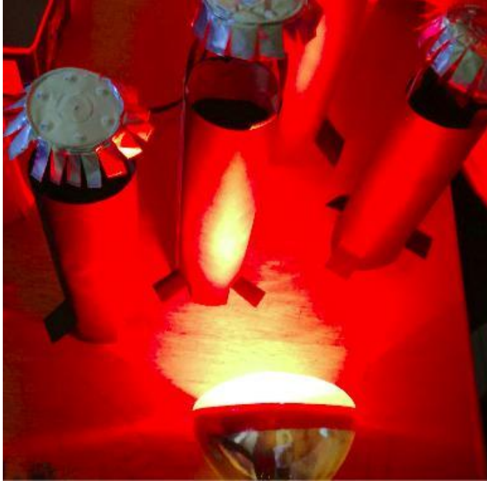
Εικόνα 2: Παρατηρούμε πώς ο ζεστός αέρας ανεβαίνει προς τα πάνω με μια απλή κατασκευή.