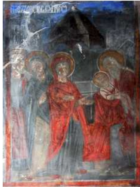
5: , μ μ