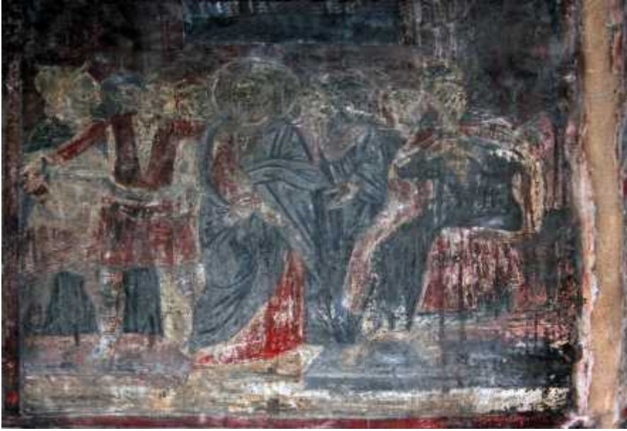
3: , μ .