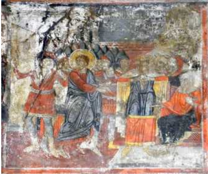
7: ( , 2010, 360, . 16)