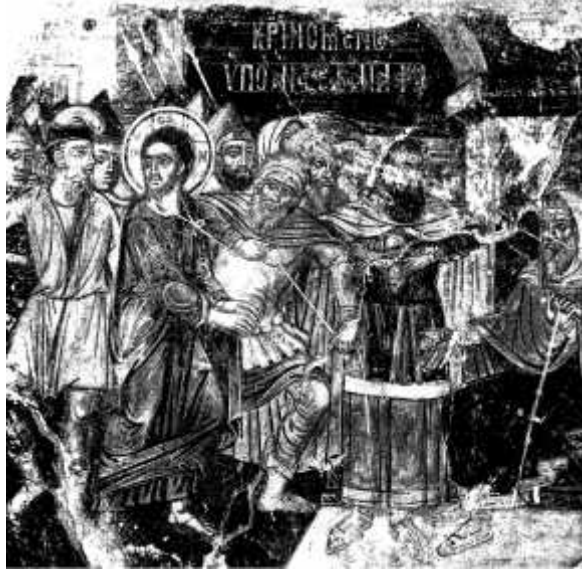
9: , & 2008, 233, .24)