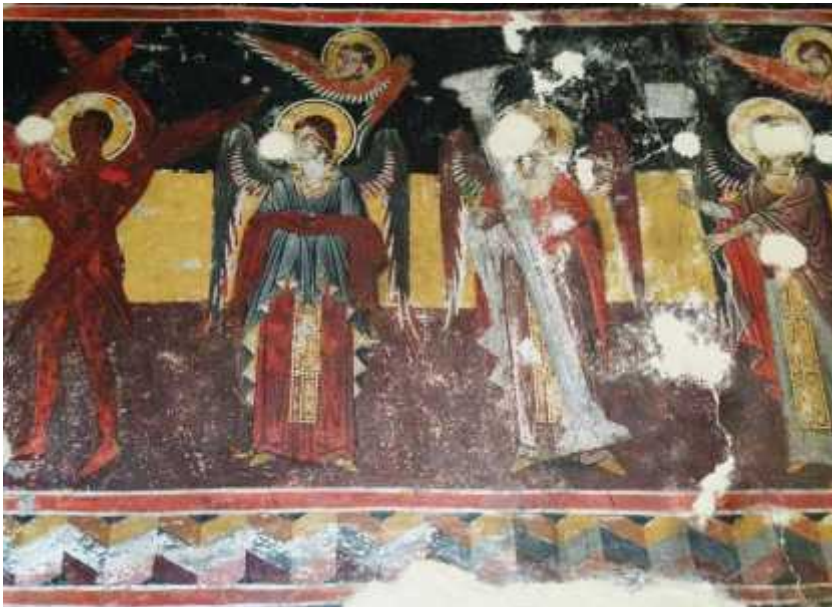
6: , ( 2010, 363, . 21 )