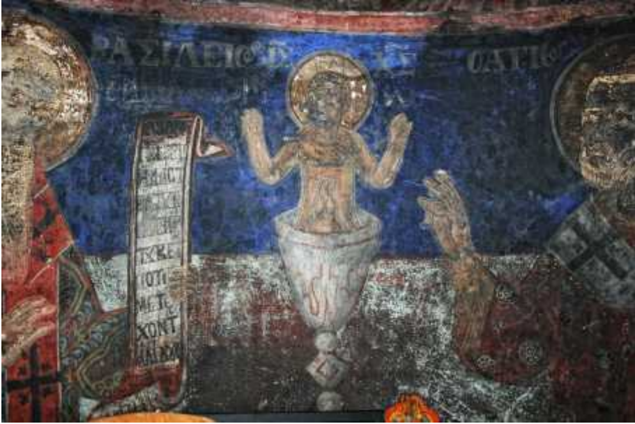
1: , μ . μ