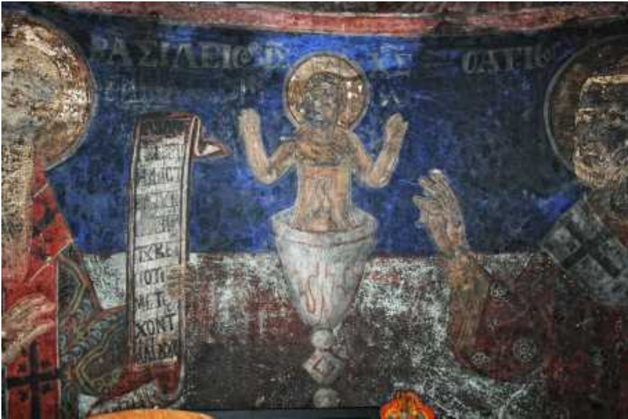
1: , μ . μ