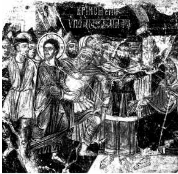
9: , & 2008, 233, .24)