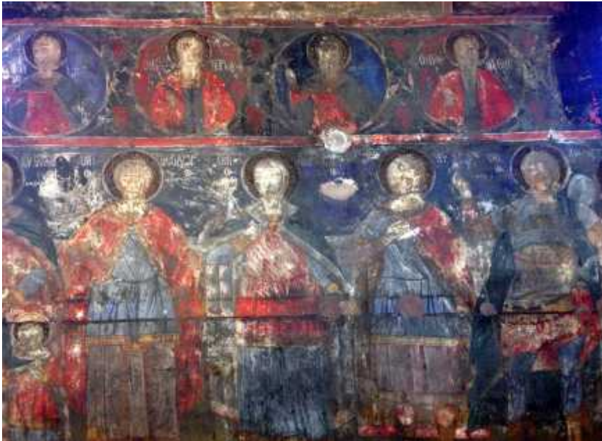
4: , μ .