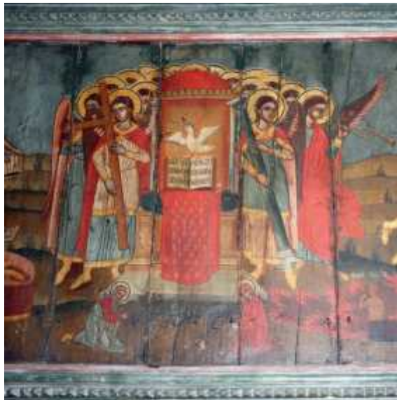
8: ( , μ , http://archive.ert.gr/7589/ )