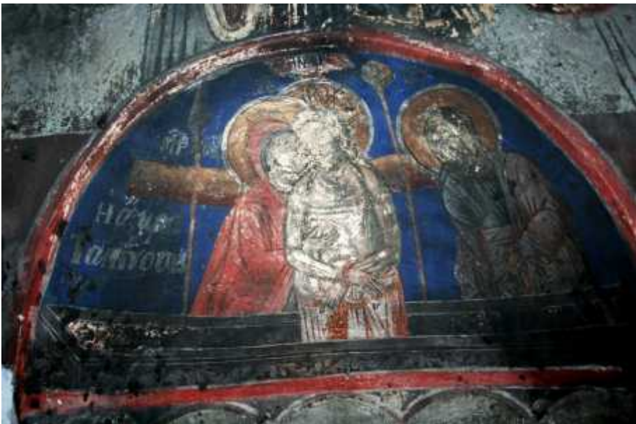
2: , μ .