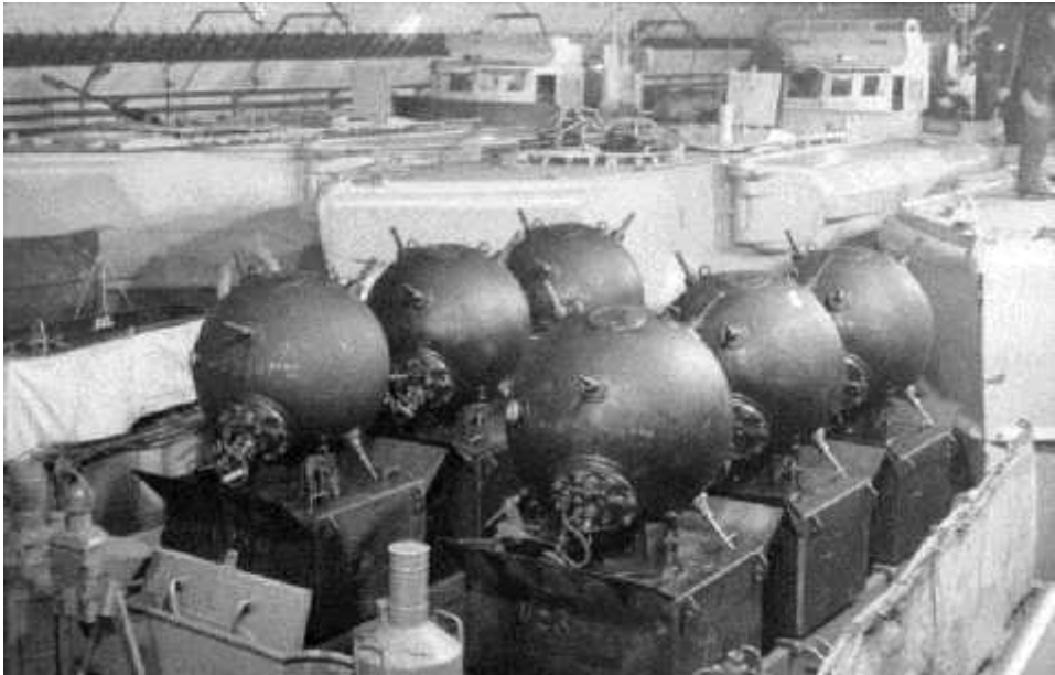
3: \mu

200 \mu \mu , \mu\mu 100 \mu \mu 330 \mu ( \mu GX, - ( Torpedine , \mu ), - \mu ) 2 \mu \mu 275 - \mu \mu 64 - 1944. 3 \mu , \mu \mu - , 1945 \mu .