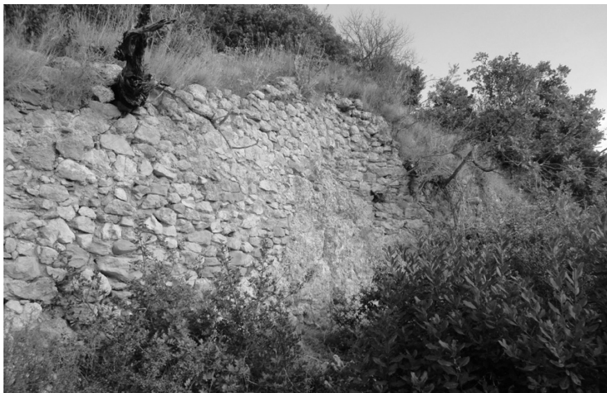
ΕΙΚΟΝΑ 12: Πλούσια βλάστηση εντός του κάστρου. Τρίτος περίβολος. Τμήμα των δυτικών τειχών του. Εκτός των τειχών. Άποψη από βορειοδυτικά