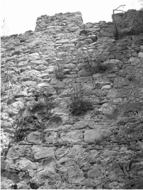
ΕΙΚΟΝΑ 10: Δεύτερος περίβολος. Τμήμα των δυτικών τειχών του. Διακρίνονται δύο διαφορετικές οικοδομικές φάσεις