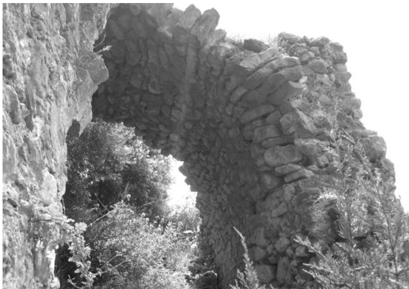
ΕΙΚΟΝΑ 8: Η πύλη του δεύτερου περιβολου. Εξωτερικά της πύλης. Αποψη από βορρά