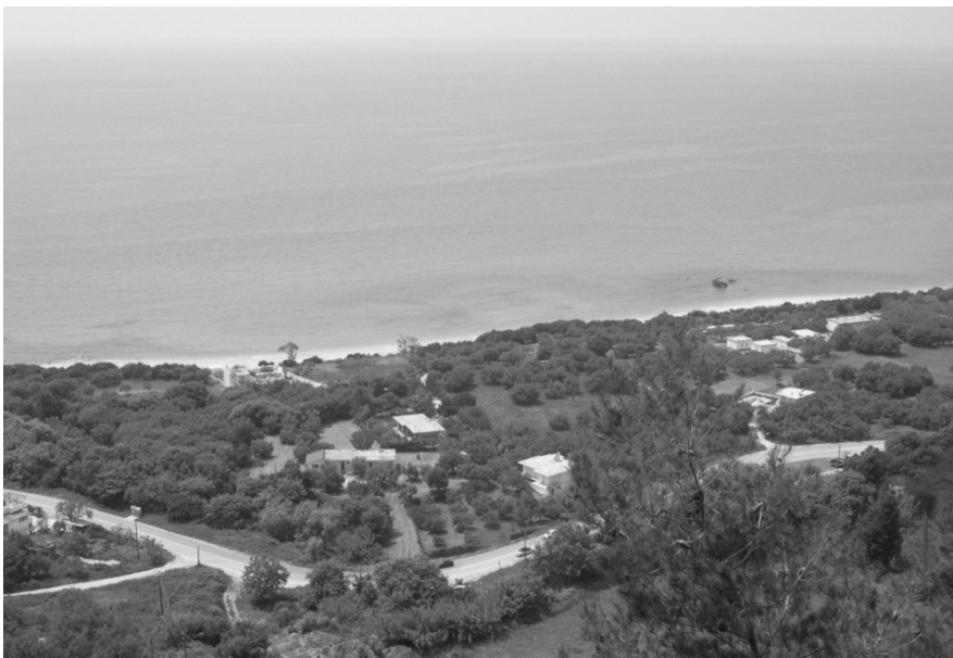
ΕΙΚΟΝΑ 5: Πανοραμική θέα από το κάστρο. Αποψη από ανατολικά