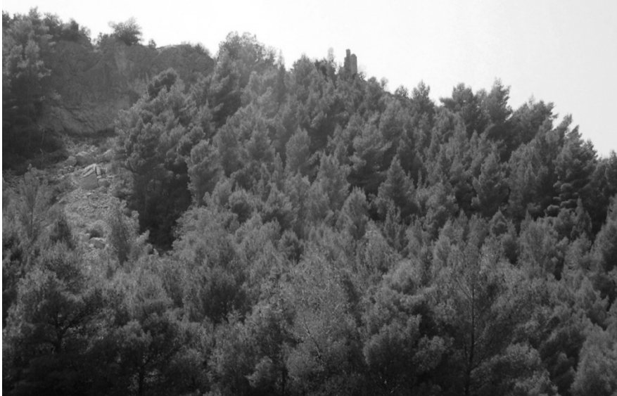
ΕΙΚΟΝΑ 4: Το ύψωμα του κάστρου. Αποψη από ανατολικά