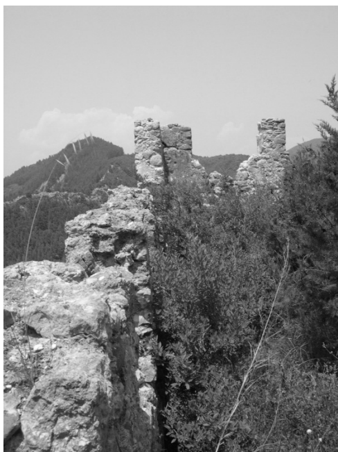
ΕΙΚΟΝΑ 7: Δεύτερος περίβολος. Τμήμα των βόρειων τειχών του. Εντός των τειχών. Αποψη από νότο.