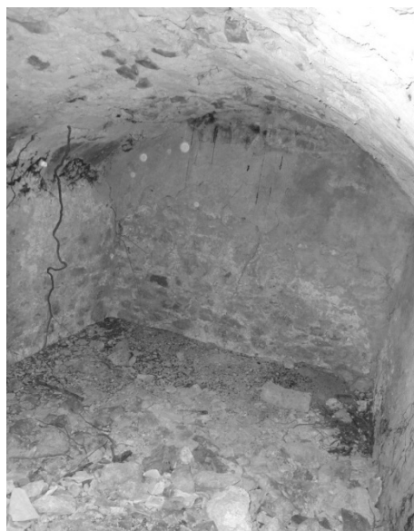
ΕΙΚΟΝΑ 13 και 14: Η βόρεια (αριστερά) και νότια δεξαμενή (δεξιά) εντός της οχυρωμένης ακρόπολης. Άποψη από το εσωτερικό της (Φωτογραφίες Νίκου Δ. Καράμπελα, 2011)