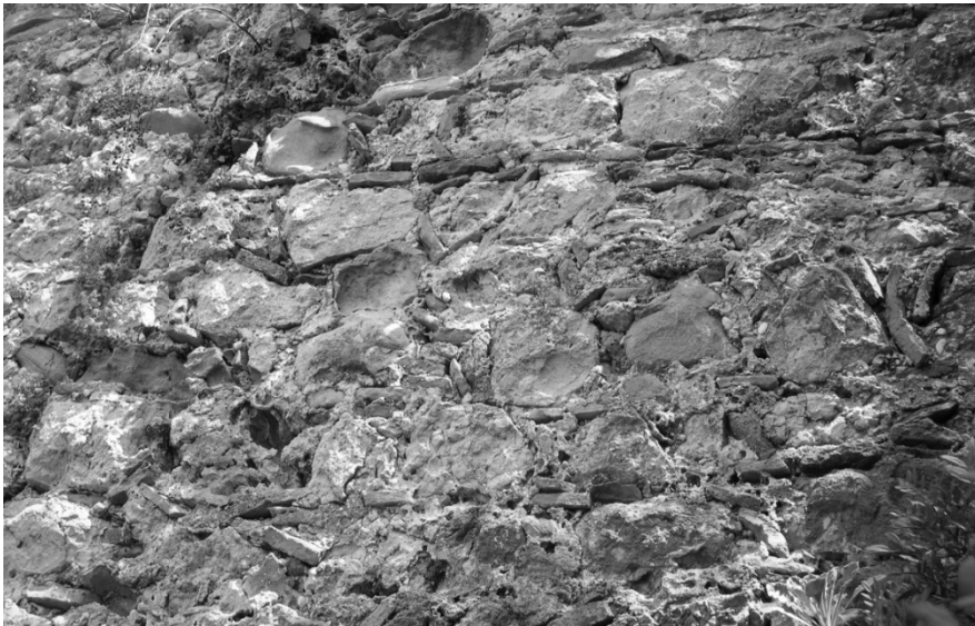
ΕΙΚΟΝΑ 11: Λεπτομέρεια τμήματος των δυτικών τειχών