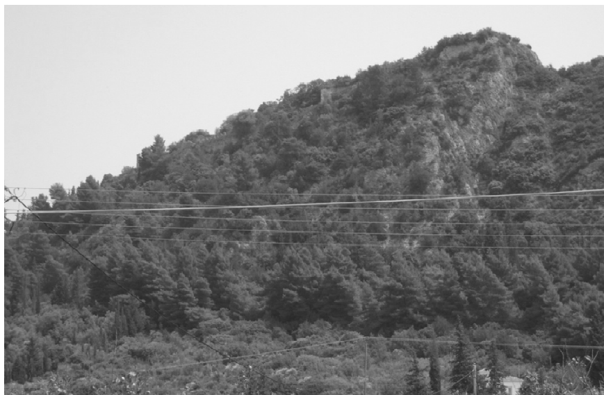
ΕΙΚΟΝΑ 3: Το ύψωμα του κάστρου. Άποψη από δυτικά