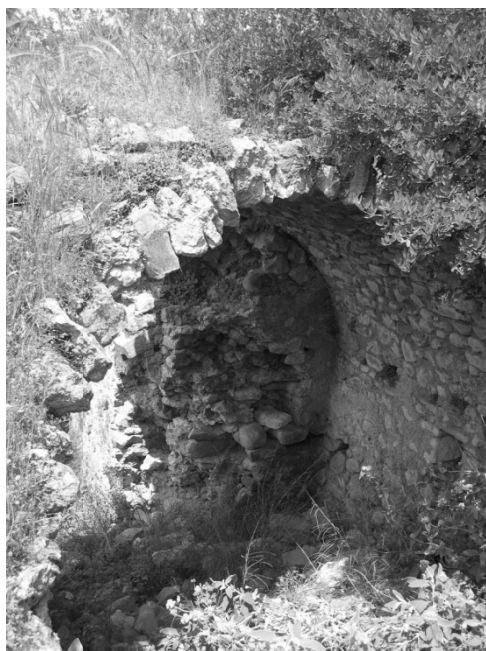
ΕΙΚΟΝΑ 9: Η πύλη του δεύτερου περιβολου. Εντός των τειχών. Αποψη από νοτιοδυτικά