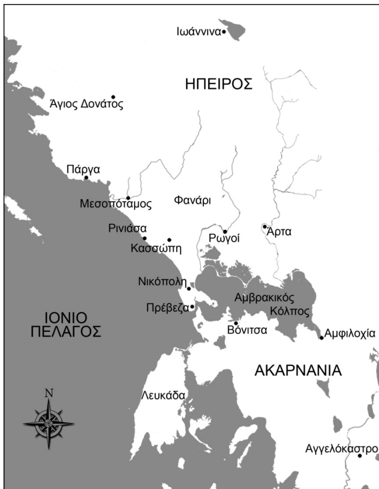
ΕΙΚΟΝΑ 1: Χάρτης της Ηπείρου και της Ακαρνανίας με σημαντικά κέντρα της εποχής από τις πηγές και την αρχαιολογική έρευνα (Επεξεργασία Γιάννης Β. Παπαλέξης)