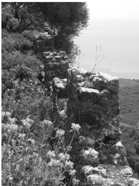
ΕΙΚΟΝΑ 6: Δεύτερος περίβολος. Επάλξεις των δυτικών τειχών του. Αποψη από βορρά.