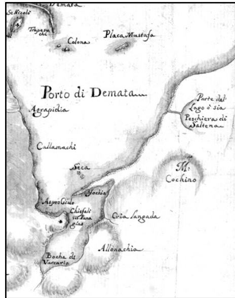
ΕΙΚΟΝΑ 3: Leptoméria χάρτη του 1729 όπου εικονίζονται μερικά από τα ιχθυοτροφεία της Ακαρνανίας (ΚΑΤΣΙΑΡΑΗ-HERING 2004, 109)

Αξίζει, επίσης, να αναφερθεί ότι στα τέλη του 18 ου αιώνα ο Αλή Τεπελενλής, πασάς των Ιωαννίνων, διεκδικούσε σθεναρά τη Βουβάλα και την Κορωνησία, δύο βραχονησίδες του κόλπου. 28 Τίθεται, λοιπόν, το ερώτημα εφόσον κατά τους Οθωμανούς τα νερά του Αμβρακικού αποτελούσαν τμήμα της