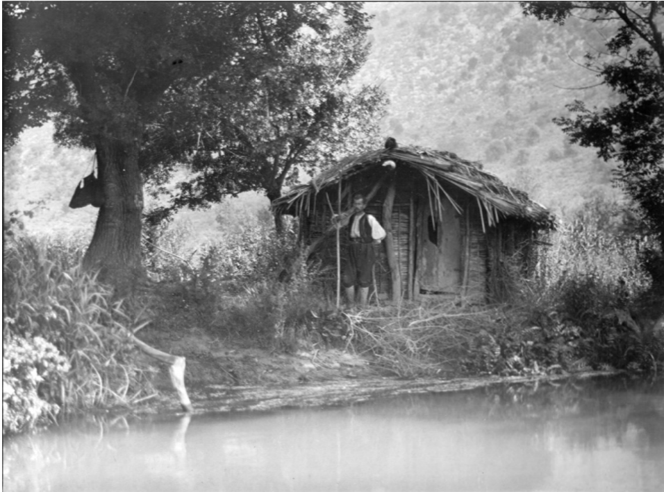
ΕΙΚΟΝΑ 5: Φύλακας διβαρίου στον Λούρο στις αρχές του 20 ο αιώνα. 1913

Εκτός από τα πριάρια οι αλιείς στις λιμνοθάλασσες χρησιμοποιούσαν δύο ακόμα τύπους αβαθών σκαφών με κουπιά, τις γαΐτες και τα μονόξυλα. 64 Επρόκειτο για μικρού μεγέθους σκάφη κατασκευασμένα σε τοπικά μικρά ναυπηγεία –ένα υπήρχε στην Κόπραινα στη βορειοανατολική ακτή του Αμβρακικού προς την πλευρά της Άρτας 65 – χρησιμοποιώντας ξυλεία από τα γύρω δάση βελανιδιάς. 66 Αυτά τα σκάφη χωρούσαν έναν μόνο άνθρωπο και τον απαραί-