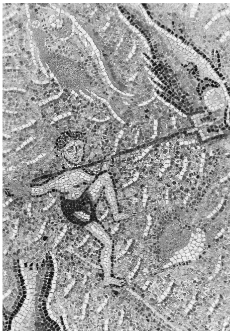
ΕΙΚΟΝΑ 1: Ψηφιδωτό δάπεδο από τη βασιλική του Δουμετίου στη Νικόπολη, στο οποίο εικονίζεται ψαράς με καμάκι (ΖΑΛΑΧΩΡΗ et al. 2001, 38)

παράγοντας της οικονομικής ανάπτυξης της περιοχής ήταν το ψάρεμα στην ανοιχτή θάλασσα και τα ιχθυοτροφεία. 3