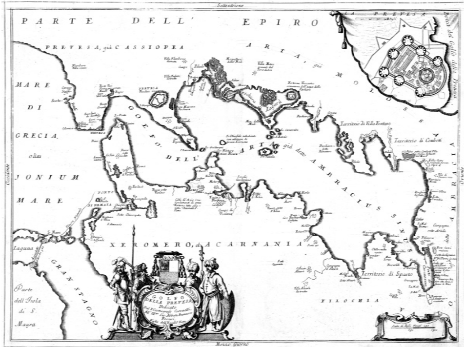
ΕΙΚΟΝΑ 2: Ο Αμβρακικός κόλπος στα τέλη του 17 ου αιώνα διά χειρός Coronelli (ΚΑΡΑΜΠΕΛΑΣ 2006, No. 10)

μοσίου Ταμείου της Λευκάδας, όπου οι ιδιώτες μισθωτές κάθε χρόνο κατέβαλαν το ενοίκιο. Λόγω, όμως, της γειννίαςης με την οθωμανική επικράτεια και του αμφισβητούμενου πολλές φορές ιδιοκτησιακού καθεστώτος των ιχθυοτροφείων, οι ενοικιαστές ήταν υποχρεωμένοι να καταβάλλουν εισφορές και στον Οθωμανό διοικητή της Άρτας. 18 Το 1757 το Βενετικό Δημόσιο εισέπραξε 504 τσεκίνα από τη φορολόγηση των ιχθυοτροφείων της Πρέβεζας ( datio delle peschiere ) 19 και 30 χρόνια αργότερα 1.429 τσεκίνα. 20 Στο Δημό-