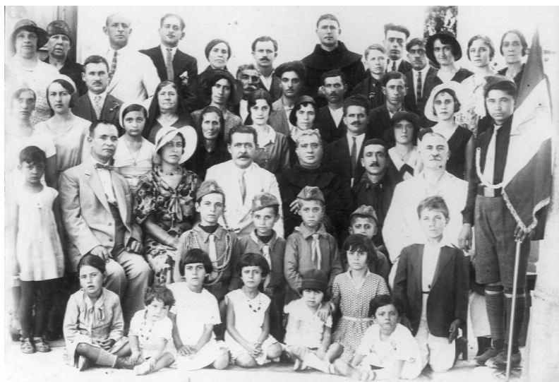
ΕΙΚΟΝΑ 4: Η Ιταλική κοινότητα Πρέβεζας. Διακρίνονται οι στολές της νεολαίας Balilla στα αγόρια