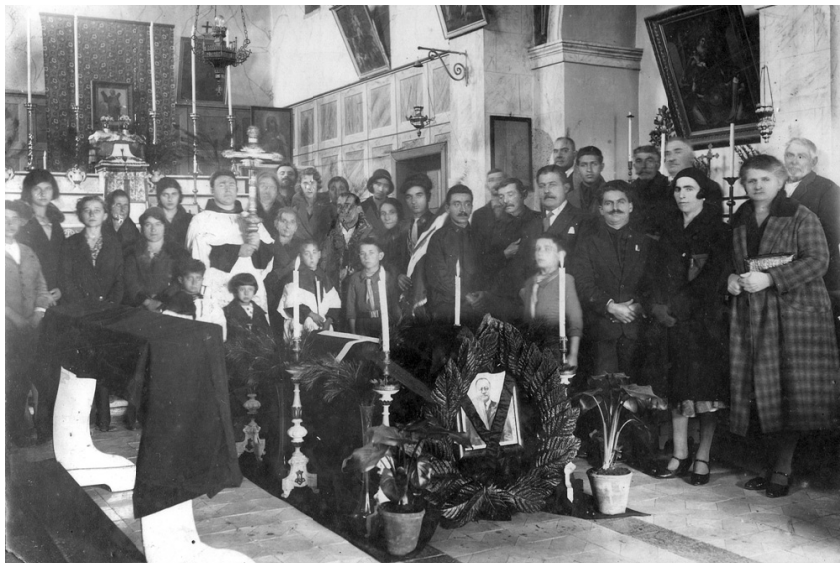
ΕΙΚΟΝΑ 5: Κηδεία στον καθολικό ναό του Αγίου Ανδρέα