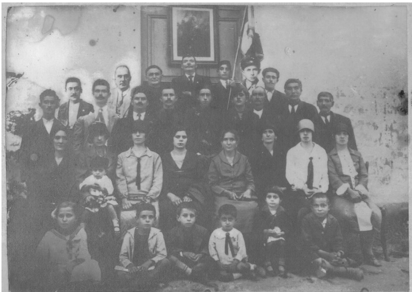
ΕΙΚΟΝΑ 6: Αναμνηστική φωτογραφία μπροστά στον ναό του Αγίου Ανδρέα