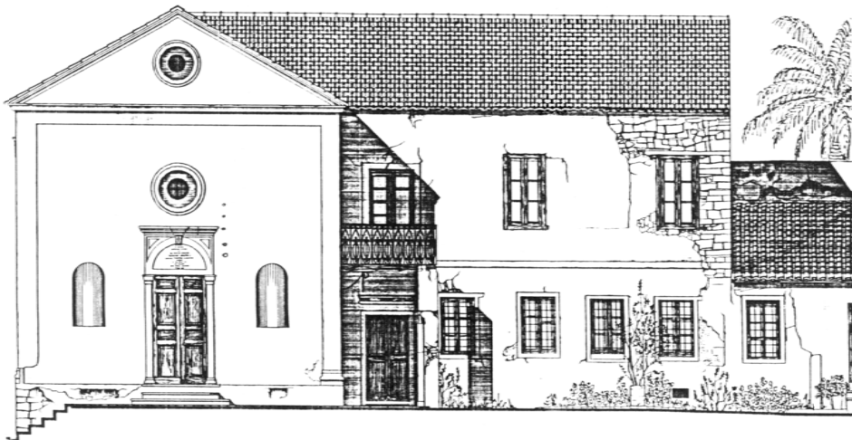
ΕΙΚΟΝΑ 1: Η δυτική όψη της καθολικής εκκλησίας του Αγίου Ανδρέα και των παρακολουθημάτων της. Σχέδιο της αρχιτέκτονος Κυριακής Παραθύρα, 1990