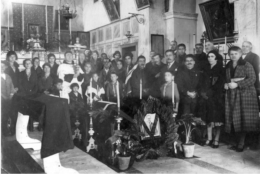
ΕΙΚΟΝΑ 5: Κηδεία στον καθολικό ναό του Αγίου Ανδρέα