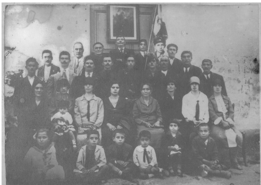
ΕΙΚΟΝΑ 6: Αναμνηστική φωτογραφία μπροστά στον ναό του Αγίου Ανδρέα