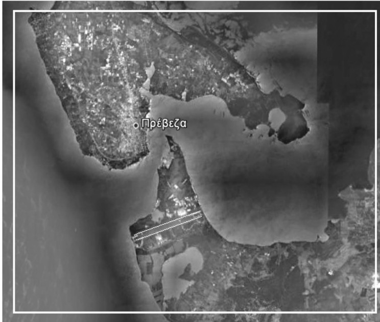
ΕΙΚΟΝΑ 4: Το χαρτογραφικό ίχνος του αεροδιαδρόμου του Ακτίου αποτελεί προσεγγιστική εικόνα του ορίου της ελληνικής επικράτειας έως το 1881. Η Ελλάδα εκτεινόταν νοτίως της ευθείας αυτής. Άρα, η τελευταία προ-ελλαδική περιφέρεια της Πρέβεζας περιλαμβάνει και το Ακτιο (Πηγή Google Earth)

Όσο και αν σέβεται το Μεσολόγγι της θυσίας (με τους τόσους Πρεβεζάνους οπλαρχηγούς και απλούς ανθρώπους, που φαίνεται πως βοήθησαν τους πολιορκημένους, όπως υπαινίσσεται ή αναλύει 23 ) το βλέπει να αντιπροσωπεύει μια εθνική περιφερειακή ενότητα που δεν θα έπρεπε να είναι όλη δική του. Πάντως, πιστεύουμε πως θεωρεί την πόλη μας alter ego της Ιεράς Πόλης και οι πολλαπλές αναφορές του σε αυτήν αποτελούν υποδειγματικά διδακτικά στοιχεία σύγκρισης (που είναι μια μέθοδος διδασκαλίας των πόλεων) με μια πόλη, 24 το Μεσολόγγι, με την οποία συνορεύουμε και συνυπάρχουμε στην υπανάπτυξη της Δυτικής Ελλάδας.