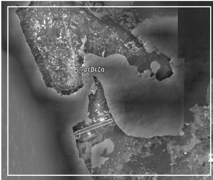
ΕΙΚΟΝΑ 4: Το χαρτογραφικό ίχνος του αεροδιαδρόμου του Ακτίου αποτελεί προσεγγιστική εικόνα του ορίου της ελληνικής επικράτειας έως το 1881. Η Ελλάδα εκτεινόταν νοτίως της ευθείας αυτής. Άρα, η τελευταία προ-ελλαδική περιφέρεια της Πρέβεζας περιλαμβάνει και το Ακτιο

Όσο και αν σέβεται το Μεσολόγγι της θυσίας (με τους τόσους Πρεβεζάνους οπλαρχηγούς και απλούς ανθρώπους, που φαίνεται πως βοήθησαν τους πολιορκημένους, όπως υπαινίσσεται ή αναλύει 23 ) το βλέπει να αντιπροσωπεύει μια εθνική περιφερειακή ενότητα που δεν θα έπρεπε να είναι όλη δική του. Πάντως, πιστεύουμε πως θεωρεί την πόλη μας alter ego της Ιεράς Πόλης και οι πολλαπλές αναφορές του σε αυτήν αποτελούν υποδειγματικά διδακτικά στοιχεία σύγκρισης (που είναι μια μέθοδος διδασκαλίας των πόλεων) με μια πόλη, 24 το Μεσολόγγι, με την οποία συνορεύουμε και συνυπάρχουμε στην υπανάπτυξη της Δυτικής Ελλάδας.