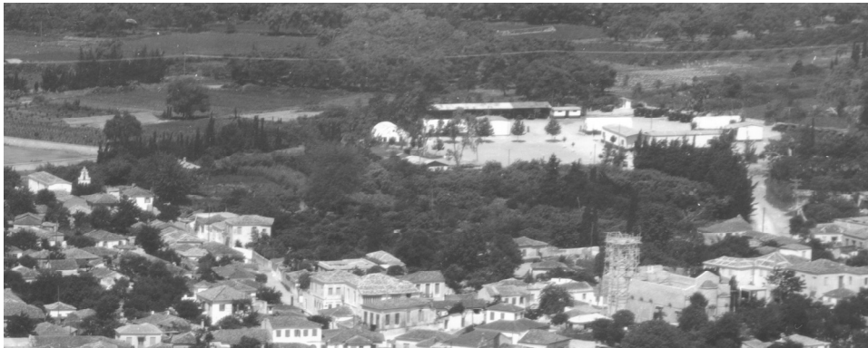
ΕΙΚΟΝΑ 16: Η περιοχή «Πυροβολικό» της Πρέβεζας. Στον χώρο της μονάδας Πυροβολικού υπήρχε το οθωμανικό νοσοκομείο. Η στρατιωτική μονάδα φαίνεται στο κέντρο δεξιά της αεροφωτογραφίας. Κάτω δεξιά ο νεόδμητος ναός του Αγίου Βασιλείου. Αριστερά ο παλαιός ναός του Προφήτη Ηλία. Αεροφωτογραφία της 22.5.1963