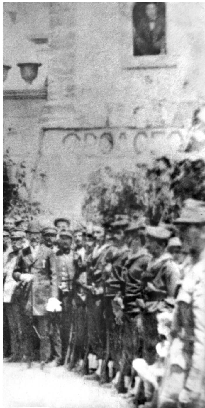
Ο μητροπολίτης Ιωακείμ και αξιωματούχοι αναμένουν τους Έλληνες αξιωματικούς, έξω από τον μητροπολιτικό ναό του Αγίου Χαράλάμπους, πριν την τέλεση δοξολογίας για την απελευθέρωση της Πρέβεζας (Αρχείο Ιεράς Μητροπόλεως Νικοπόλεως & Πρεβέζης) (Επεξεργασία φωτογραφίας: Γιάννης Β. Παπαλέξης)