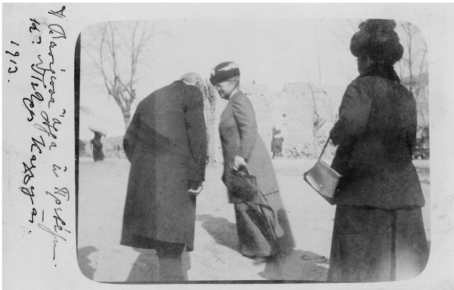
ΕΙΚΟΝΑ 9: Καρτ ποστάλ αγνώστου εκδότη (IAN F1199)