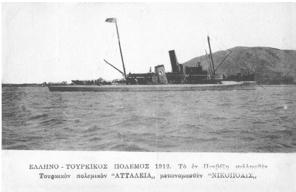
ΕΙΚΟΝΑ 11: Καρτ ποστάλ αγνώστου εκδότη (IAN F1314)