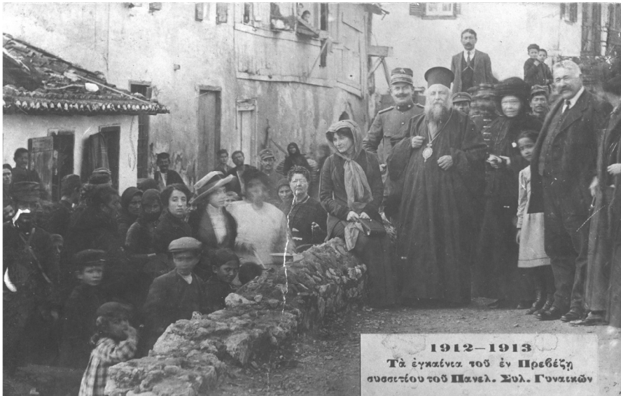
ΕΙΚΟΝΑ 4: Καρτ ποστάλ αγνώστου εκδότη (IAN F1189)