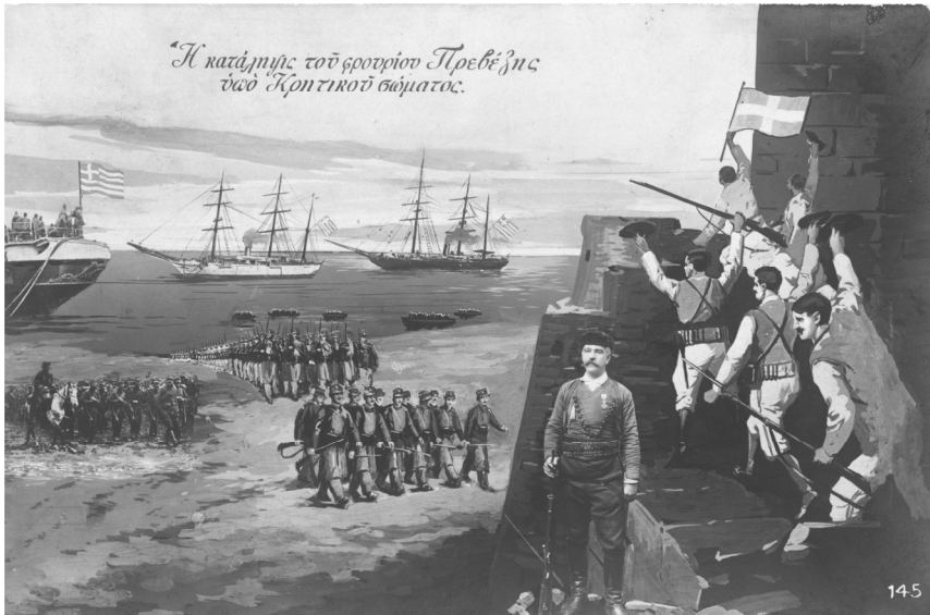
ΕΙΚΟΝΑ 2: Καρτ ποστάλ αγνώστου εκδότη (IAN F1187)