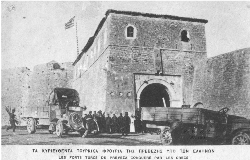
ΕΙΚΟΝΑ 6: Καρτ ποστάλ Εκδόσεων Ελληνικής Πινακοθήκης (IAN F1192)