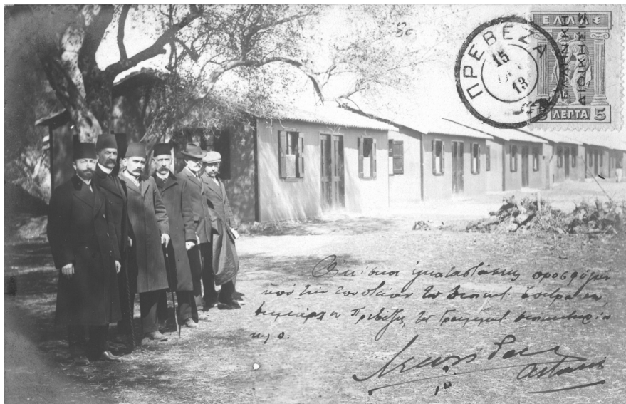
ΕΙΚΟΝΑ 7: Καρτ ποστάλ αγνώστου εκδότη (IAN F1193)