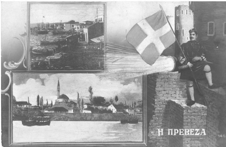
ΕΙΚΟΝΑ 3: Καρτ ποστάλ αγνώστου εκδότη (IAN F1188)