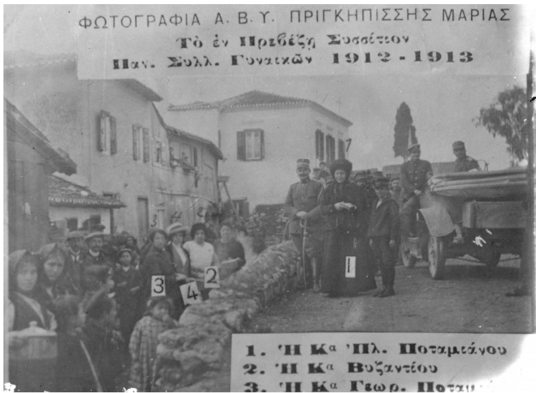
ΕΙΚΟΝΑ 8: Καρτ ποστάλ αγνώστου εκδότη (IAN F1197)