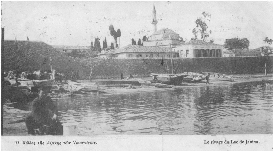
ΕΙΚΟΝΑ 10: Καρτ ποστάλ Έκδοση A. Pallis Cie – Athènes (IAN F1203)