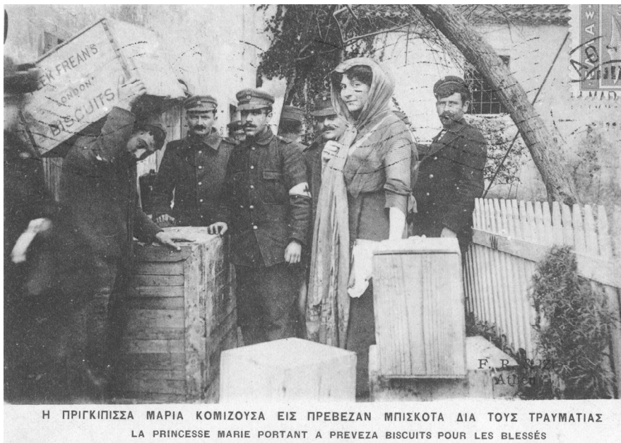
ΕΙΚΟΝΑ 5: Καρτ ποστάλ Εκδόσεων Ελληνικής Πινακοθήκης (IAN F1190)