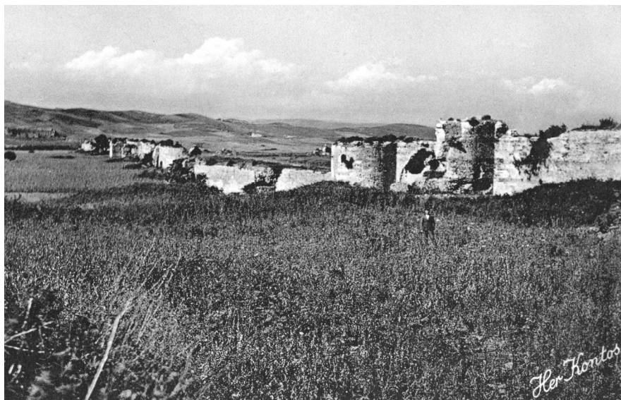
ΕΙΚΟΝΑ 5: Γενική άποψη του δυτικού σκέλους του παλαιοχριστιανικού τείχους. Καρτ ποστάλ Έκδοσης Ηράκλειου Κοντού, 1930 (Αρχείο Ιδρύματος Ακτία Νικόπολις, ΙΑΝ F1236)