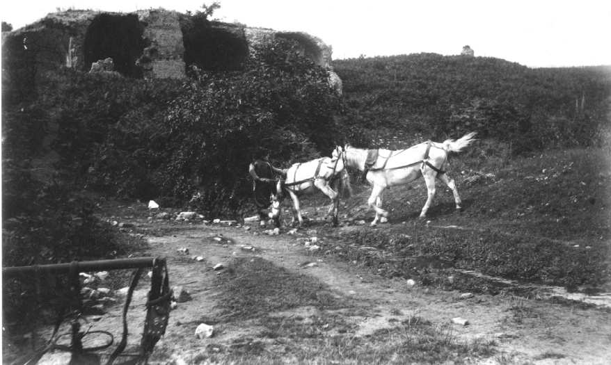
ΕΙΚΟΝΑ 3: Η πηγή κάτω από τα Βαγένια, τέλη 19 ου αι.