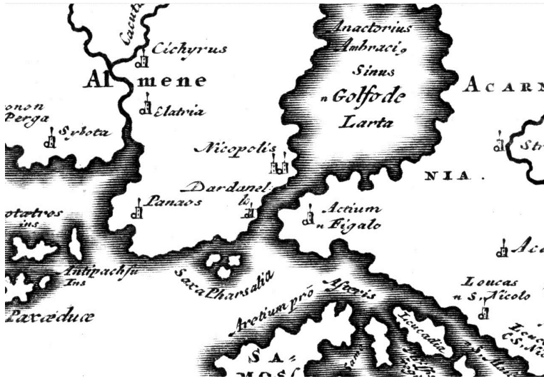
ΕΙΚΟΝΑ 1: Λεπτομέρεια χάρτη του Chouvierius με το όνομα Nicopolis, προ του 1650 (Αρχείο Ιδρύματος Ακτία Νικόπολις, IAN 198)