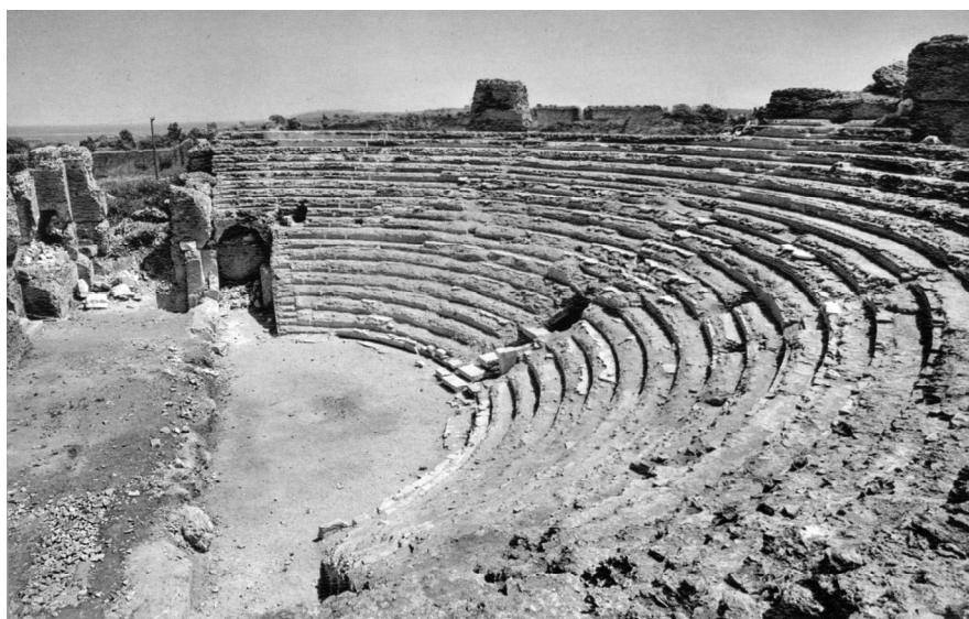
ΕΙΚΟΝΑ 6: Άποψη του Ωδείου, μετά την αποχωμάτωση του κοίλου και πριν τις εργασίες στερέωσης, 1960