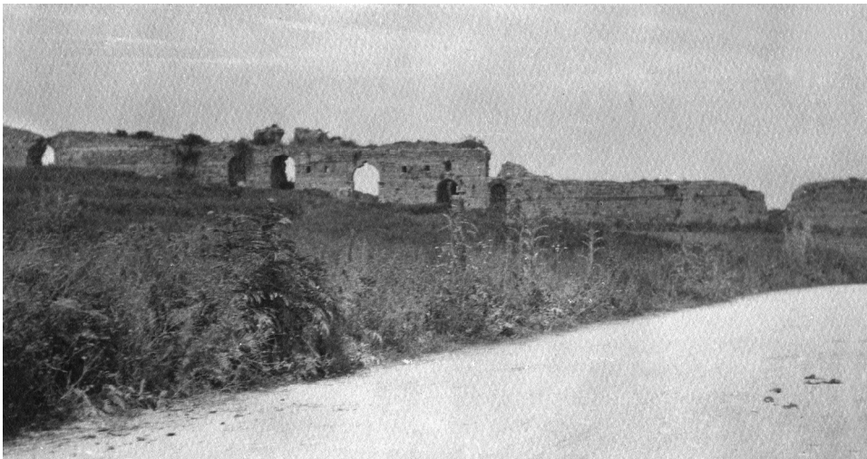
ΕΙΚΟΝΑ 2: Άποψη του δυτικού σκέλους των παλαιοχριστιανικών τειχών στο ύψος της Δυτικής πύλης. Σε πρώτο πλάνο διακρίνεται η αμαξιτή οδός (περίπου 1920)