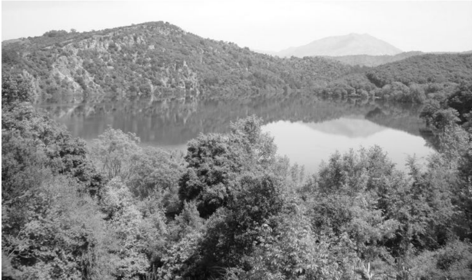
2: μ .

μ — μ μ , μ μ , — μ μ . Ο μ μ μ μ μ , μ μ . μ μ μ μ μ — μ .