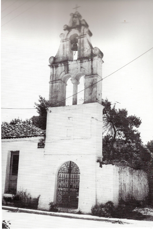
ΕΙΚΟΝΑ 2: Το καμpanariό του ναού του Προφήτη Ηλία στην Πρέβεζα

Ρωσία. Έρριξαν 105 κανονιοβολισμούς ... [και παρακάτω] Οι κώδωνες των εκκλησιών εκρούσθησαν επί πολύ της ημέρας. Και το εσπέρας εγένετο γυμνάσιον διά πυρός, την δε νύκτα εφωταγωγήθη άπασα η πόλις διά φωταυμιών εφ' άπάσας σχεδόν, τας οικίας χριστιανών και οθωμανών.