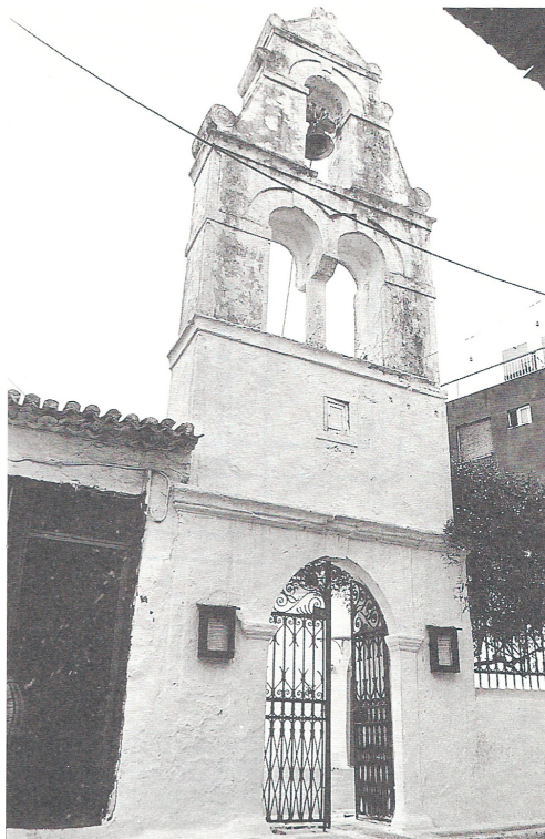
ΕΙΚΟΝΑ 3: Το κωδωνοστάσιο του ναού του Αγίου Αθανασίου στην Πρέβεζα

Η νέα καμπάνα τοποθετήθηκε το Μάρτη του 1857. Δε γράφει, όμως, τη συνολική αξία της. 6