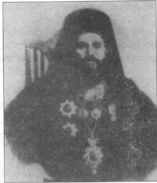
Εικ. 1. Ιωακείμ Α' Σγουρός

Εκτός από το σημαντικό ζήτημα του διωγμού της Εκκλησίας μπορεί κανείς να δει μέσα από τις δημοσιεύσεις της «Εφημερίδος» την κατάσταση στην οποία βρισκόταν η επαρχία Πρεβέζης στα 1890. Πιο συγκεκριμένα στο φύλλο 345 της Τρίτης, 11 ης Δεκεμβρίου 1890, γίνεται αναφορά στις πληθυσμιακές ομάδες της Πρέβεζας (οι μουσουλμάνοι δεν ξεπερνούν τους χίλιους), στους βαρείς φόρους που ήταν υποχρεωμένοι οι Έλληνες γεωργοί να πληρώνουν στον Τούρκο κατακτητή, στις σκληρές συνθήκες εργασίας των χωρικών για την κατασκευή