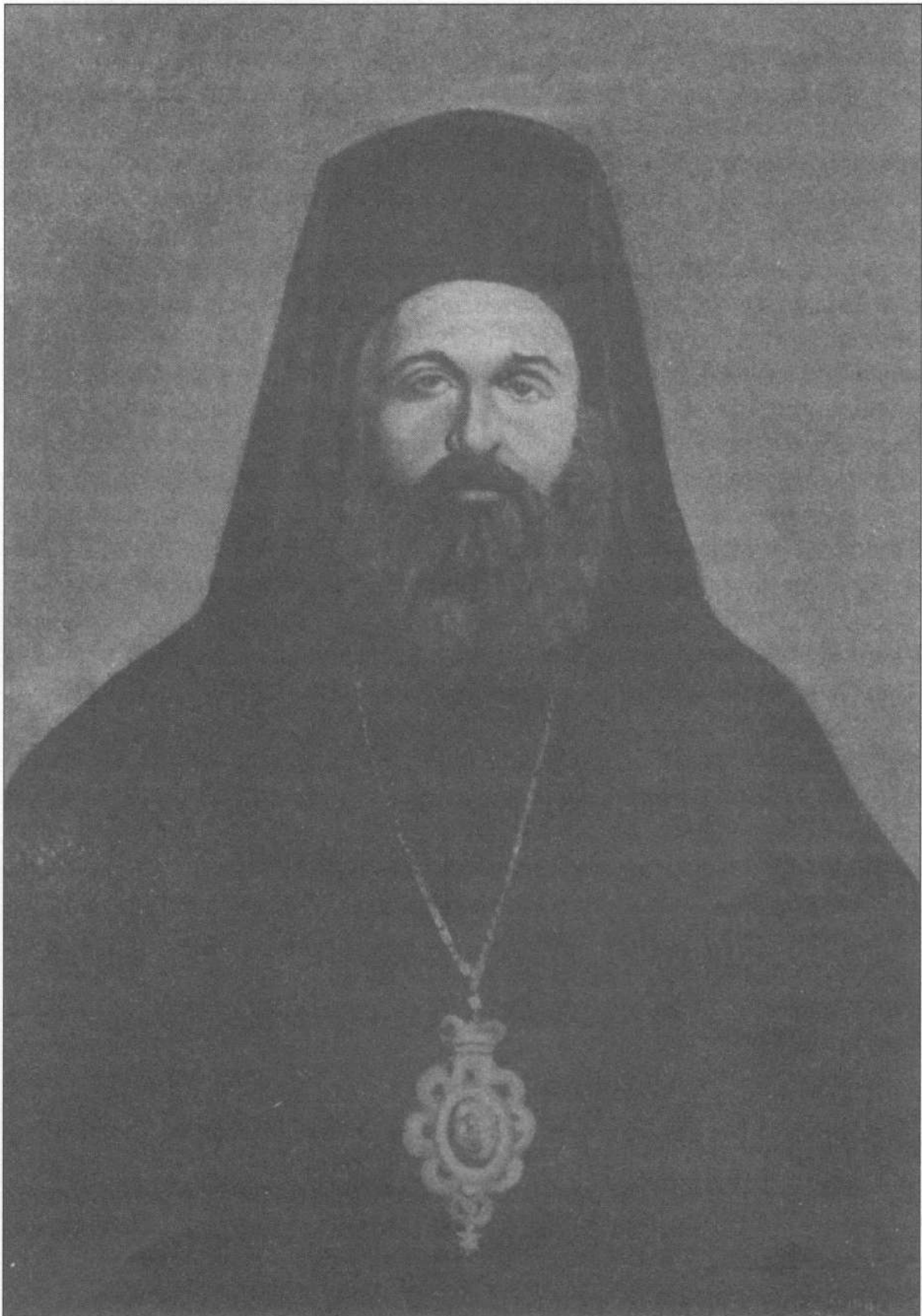
Εικ. 2. Ιωακείμ Α' Σγουρός (από έργο ζωγραφικής του Π. Σταθόπουλου, που έγινε με πρότυπο τη φωτογραφία της Εικ. 1) Αρχείο Ιδρύματος "Αχτία Νικόπολις", Πρέβεζα