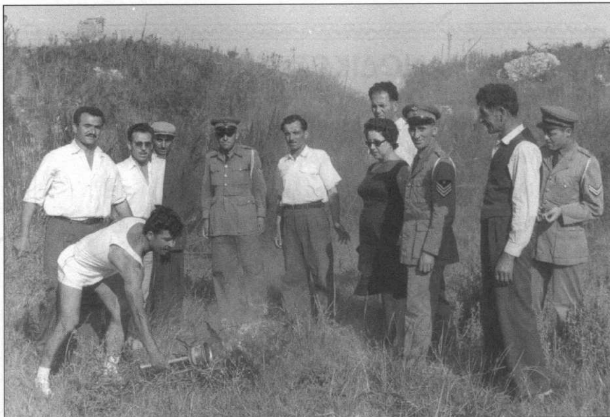
Η αφή του φωτός και η μεταφορά της δάδας από το αρχαίο Στάδιο της Νικοπόλεως