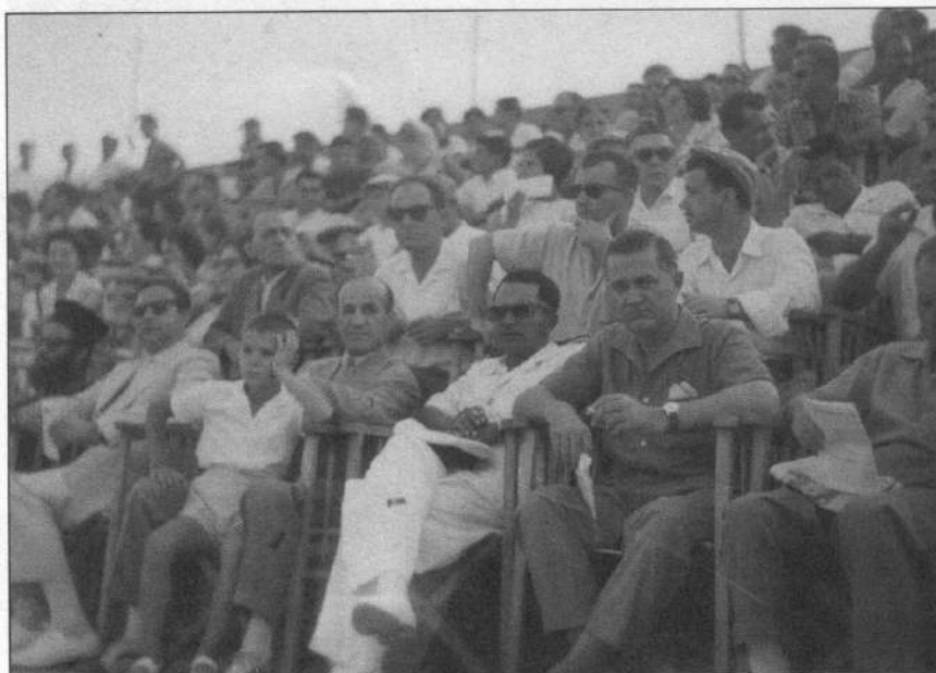
Ι' Ακτια, Πρέβεζα 30-7-1961: Επίσημοι