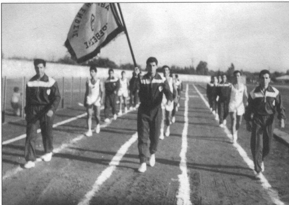
Παρέλαση αθλητών της Αθλητικής Ενώσεως Πρεβέζης στα Θ' Άκτια