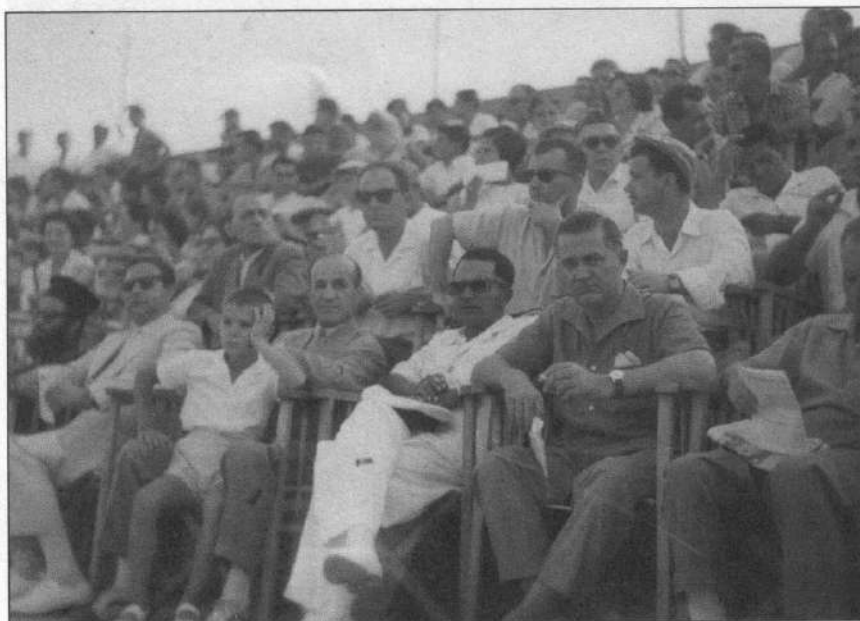
Ι' Ακτια, Πρέβεζα 30-7-1961: Επίσημοι