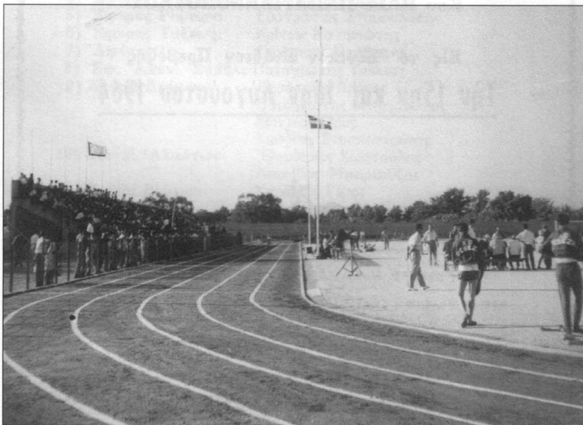
Άποψη του Εθνικού Σταδίου Πρεβέζης κατά την τέλεση των ΙΓ' Ακτίων

Την τέλεση των ΙΓ' Ακτίων τίμησαν με την παρουσία τους: ο Πανοσιολογιώτατος Ιεροκήρυξ Φιλάρετος Βιτάλης ως εκπρόσωπος του Σεβα-