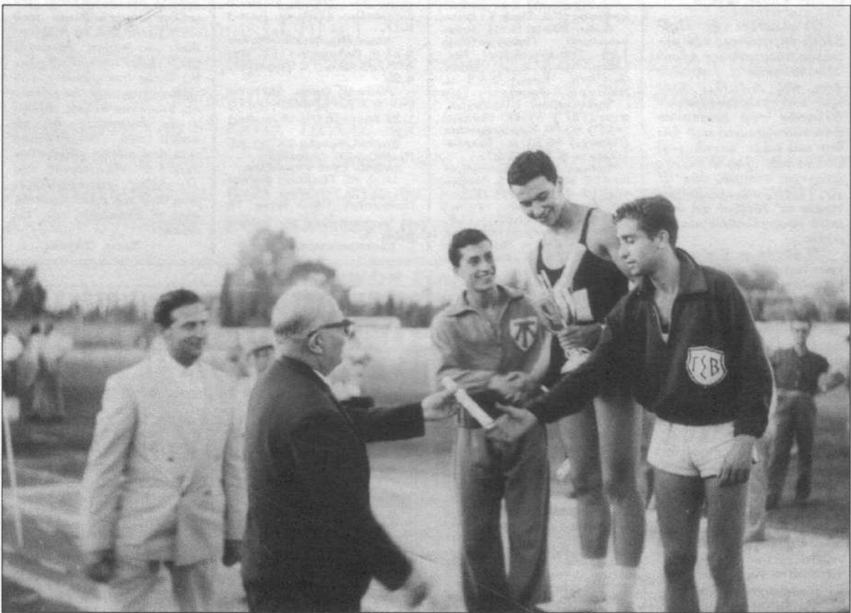
Απονομή βραβείων από το Νομάρχη Γ. Μαρκόπουλο