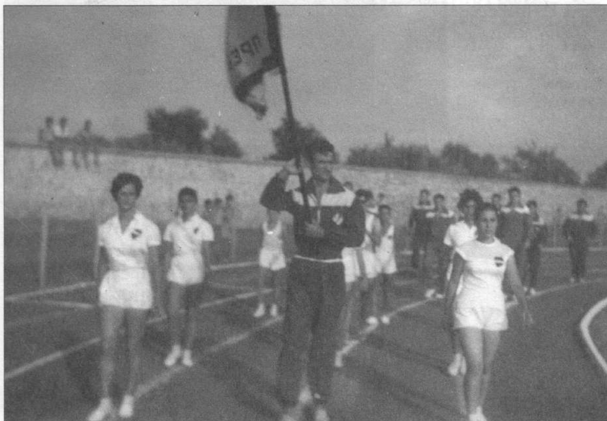
Ι' Ακτια: Παρέλαση αθλητριών της Αθλητικής Ενώσεως Πρεβέζης

Καταπληκτική ήταν η εμφάνιση του γυναικείου αθλητισμού.