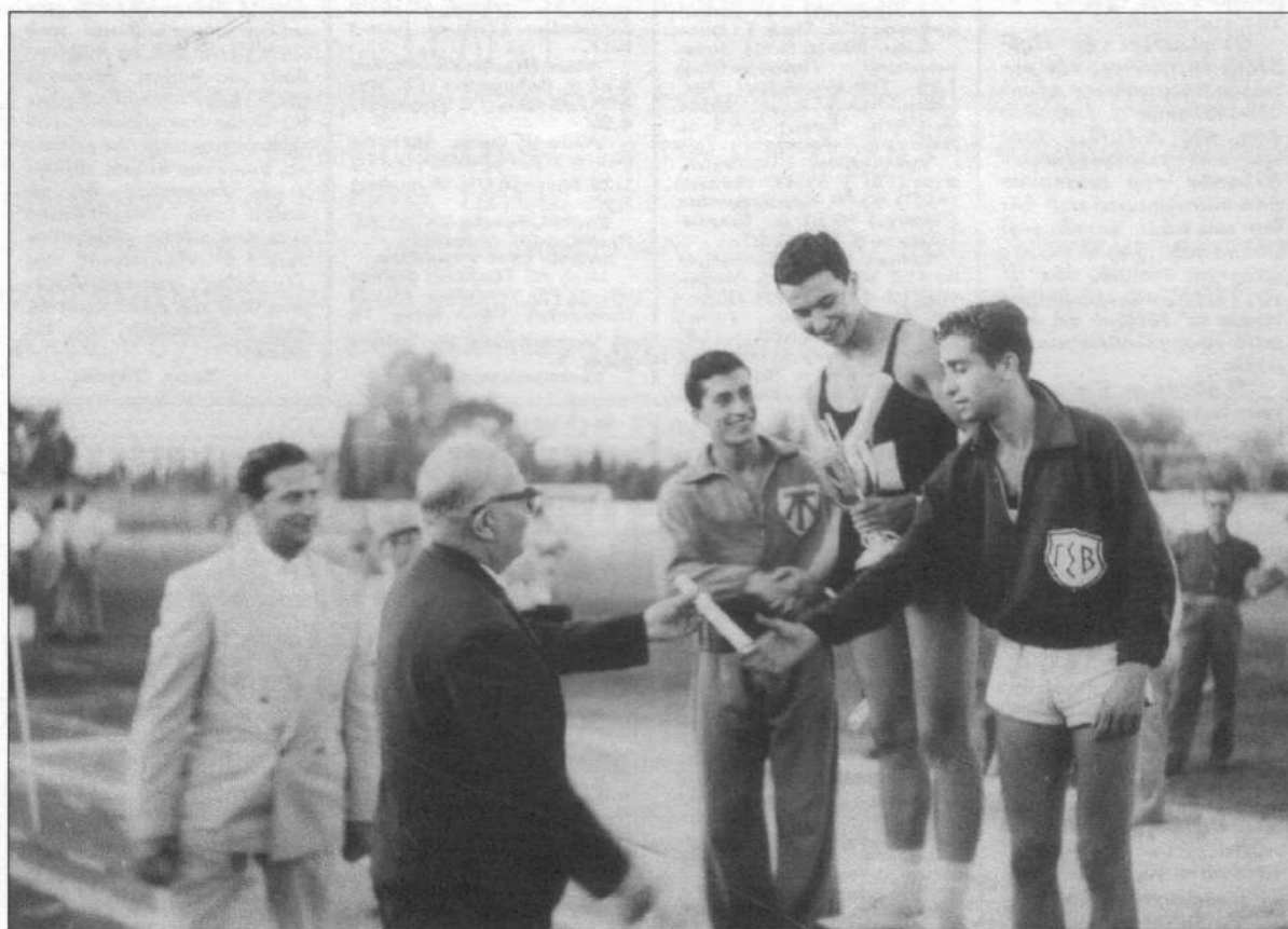
Απονομή βραβείων από το Νομάρχη Γ. Μαρκόπουλο