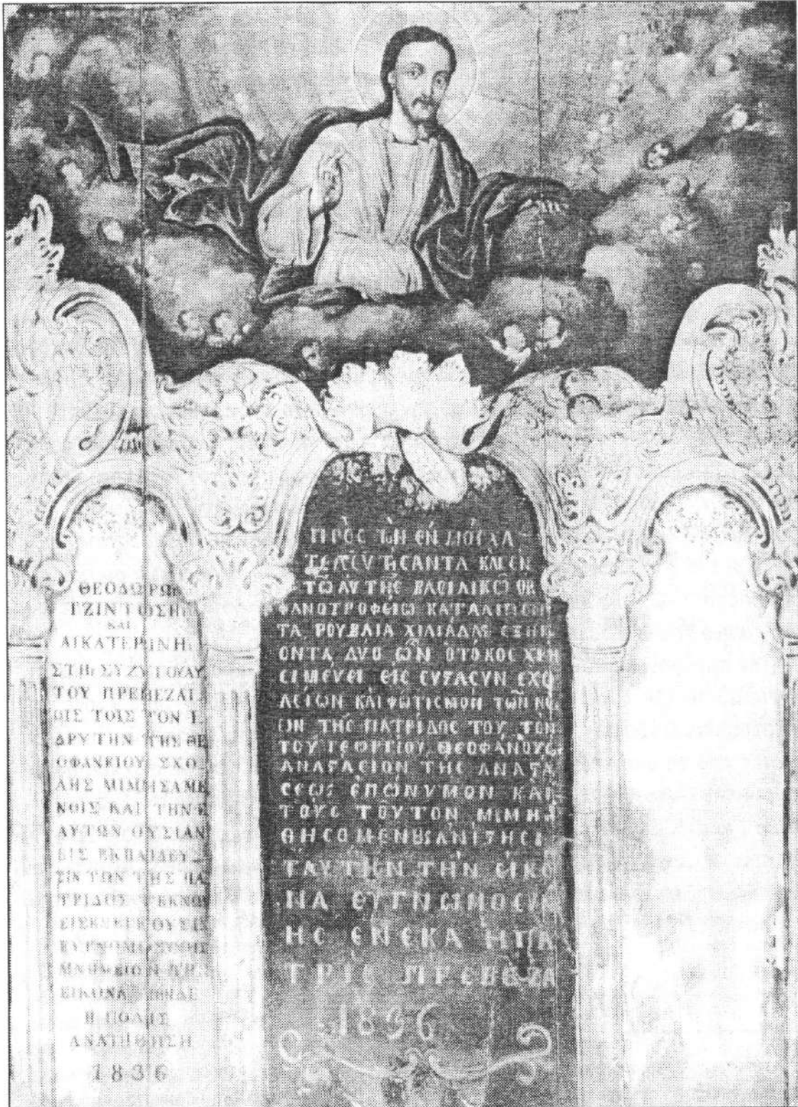
Η μεγάλη εικόνα του Παντοκράτορα που ήταν αναρτημένη στη Θεοφάνειο Σχολή και σήμερα βρίσκεται στο νέο διδακτήριο του Α' Δημ. Σχολείου Πρέβεζας