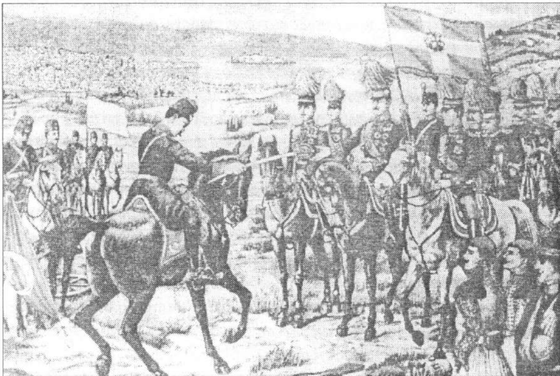
Ο Διοικητής του Τουρκικού Σώματος Ιωαννίνων Εσάτ Πασσάς παραδίδει την πόλη στον Αρχιστράτηγο των Ελληνικών Δυνάμεων Διάδοχο Κωνσταντίνο.

Ο άνθρωπος ούτος ήτο τακτικός ανά δεκαπενθήμερον σύνδεσμος μεταξύ του Επιτελείου μας και του Μητροπολίτου Ιωαννίνων. Πολύ δραστήριος Έλληνας και αποφασιστικός. Λόγω της θέσεως του χωρίου του και του δασώδους απάσης της πλευράς αυτής, κατώρθωνε να κατέρχεται