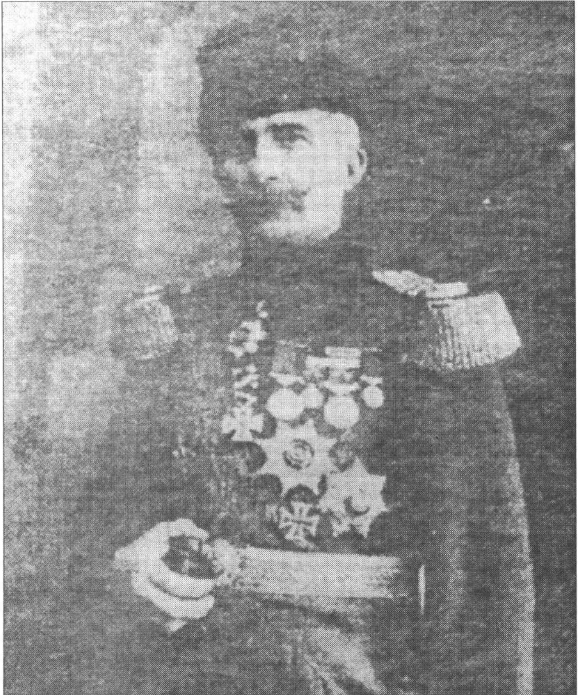
Εσάτ Πασσάς (Διοικητής του Τουρκικού Σώματος Ιωαννίνων)

Καταγόταν από έναν εκ των επτά αξιωματικών που κατέλαβαν τα Γιάννενα το 1430 υπό τον Γαζή Εβρενόζ και εκ κοπέλας, Καστρινης, της οικογένειας των Γλυκήδων, που έκανε γυναίκα του. Πατέρας του ήταν ο Δήμαρχος Ιωαννίνων Αχμέτ Χαλασκή. Τόσο αυτός όσο και ο αδελφός του Βεχρήπ-Βέης αποφοίτησαν από τη Ζωσιμαία Σχολή και ακολούθως από την Στρατιωτική Ακαδημία του Βερολίνου, όπως και ο Αρχιστράτηγος των Ελληνικών δυνάμεων πρίγκηπας Κωνσταντίνος. Μετά την απελευθέρωση των Ιωαννίνων επισκέφθηκε την πόλη δύο φορές, το 1928 και το 1934. Και τις δύο φορές ο Γιαννιώτικος τύπος, σύσσωμος, του απέδωσε μεγάλες τιμές και τον απεκάλεσε «ένα εκ των μεγάλων Ιωαννιτών».