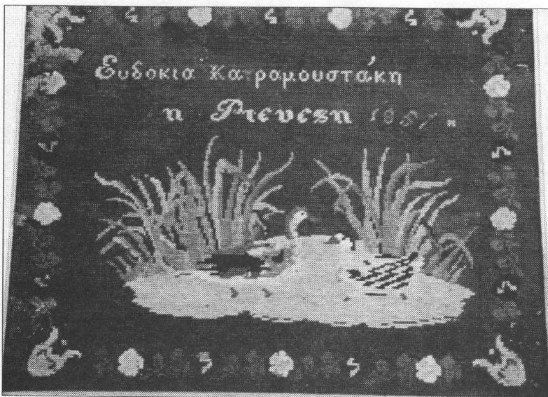
Εργόχειρο Ευδοκίας Καραμουστάκη, του 1887 στο οποίο έχει κεντήσει το επίθετό της όπως ήταν τότε, δηλ. Κατρομουστάκη.