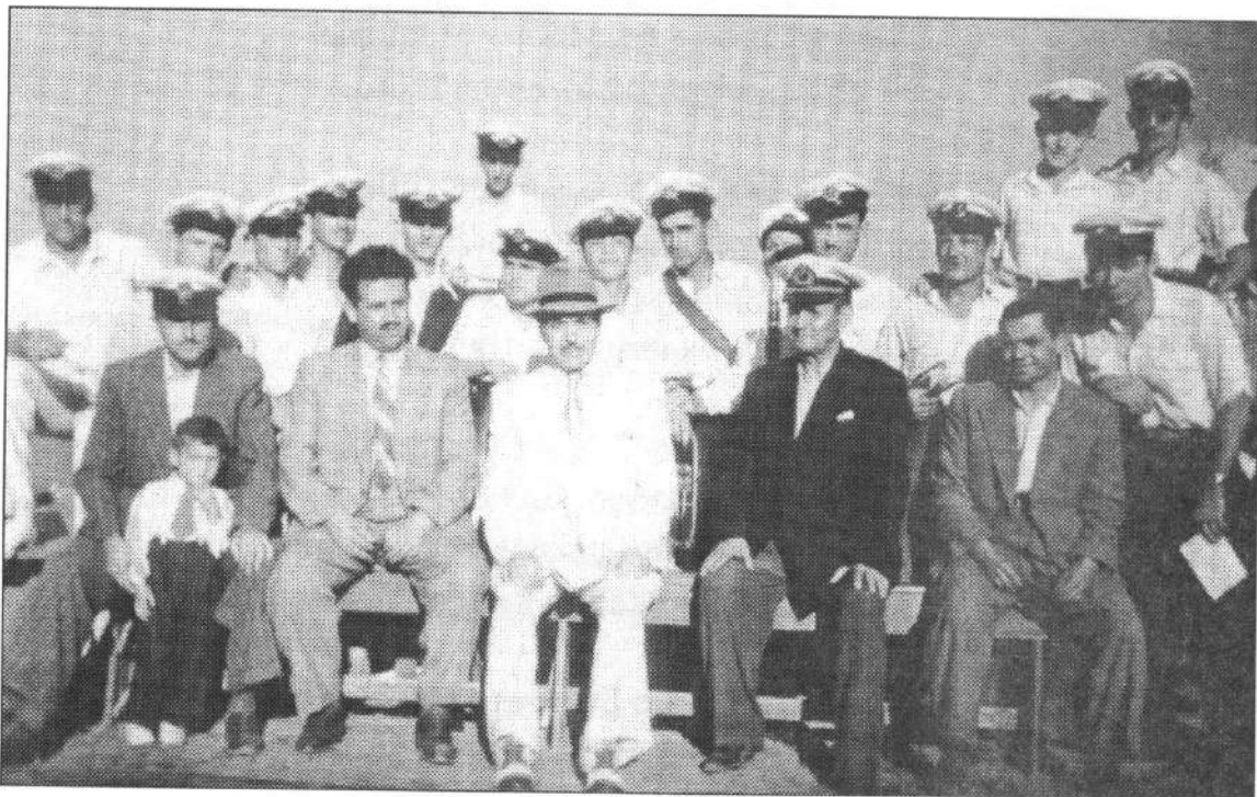
Η Φιλαρμονική της Πρέβεζας στο Στάδιο