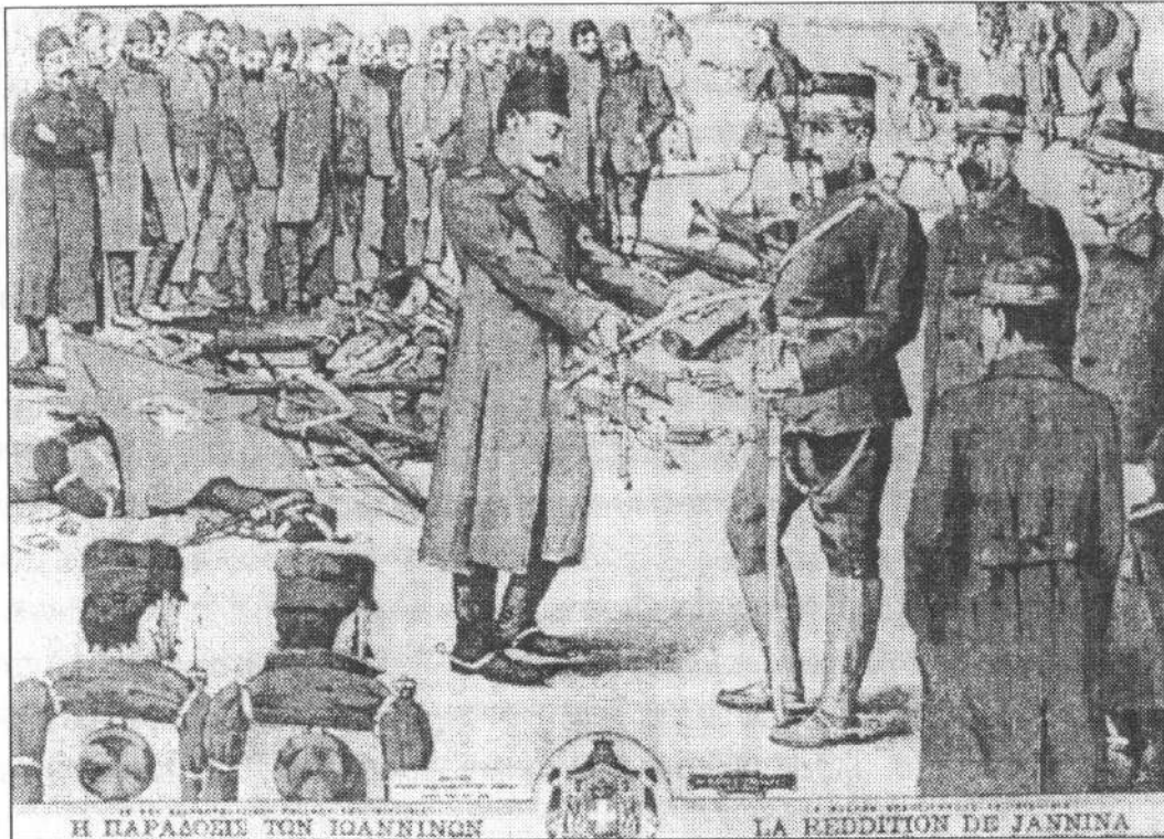
Η παράδοσις των Ιωαννίνων

Επί ένα περίπου μήνα παρέμεινα εν υπηρεσία εις το τάγμα Φιλιατών πλησίον του Κουτσελίου. Κατά το χρονικόν τούτο διάστημα ήρχισαν να κατέρχωνται εις Ιωάννινα υποχωρούντα τμήματα του Τουρκικού στρατού του περιφήμου Τζαβίτ Πασσά, εκδιωχθέντα υπό των Σέρβων εκ Μοναστηρίου, άτινα εν συνόλω έφθασαν τας 20.000 τακτικού στρατού και τα οποία ομού μετά ελαχίστων τμημάτων ευρισκομένων εις Ιωάννινα εκράτησαν επί τρίμηνον την άμυναν του Μπιζανίου και λοιπών θέσεων μέχρι της πτώσεώς των και απελευθερώσεως των Ιωαννίνων την 21/2/1913.