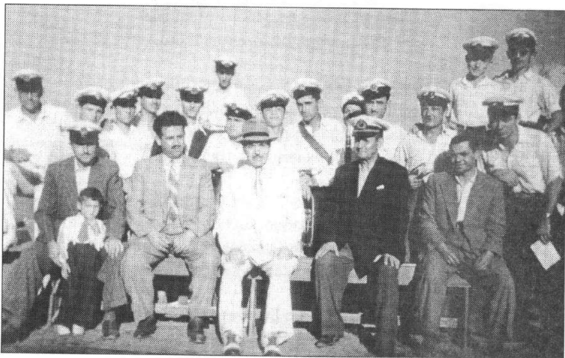
Η Φιλαρμονική της Πρέβεζας στο Στάδιο