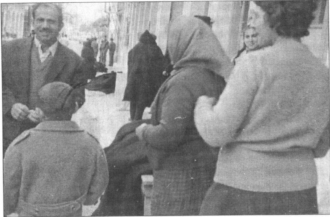
«... στου Συγκούνα τσοπαναράιοι και χωριάτες δοκίμαζαν τις κάπες» (Φωτ. 1971)

Ο Νικόλας τράβηξε ίσια για του Συγκούνα. Τούτος ο καπός ράφτης ήταν ακουστός για τη μαστοριά του στο ράψιμο της κάπας – δεν έβασε ποτέ νερό στις πλάτες. Παλιός στην τέχνη. Και τ' όνομά του μαρτυράει ότι ο παππούς του έφτιαχνε σεγκούνες αντρικές. Καλότυχος που μπήκε κι ο γιος του στην τέχνη του καπά και κάθε χρόνο, νάτος στο παζάρι της Φιλιπιάδας.