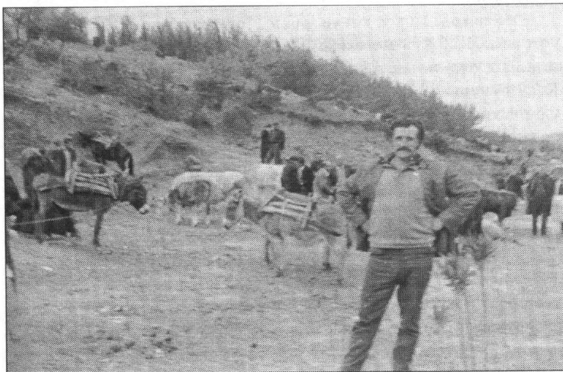
«Ζώα γερά, διαλεχτά... αλλά και κακορίζικα, γέρικα» (Φωτ. 1971)

Λέγοντας πράμα, εννοούσαν το κάθε λογής εμπόρευμα: Ζώα γερά, διαλεχτά που να γυαλίζει η τρίχα τους, αλλά και κακορίζικα, γέρικα