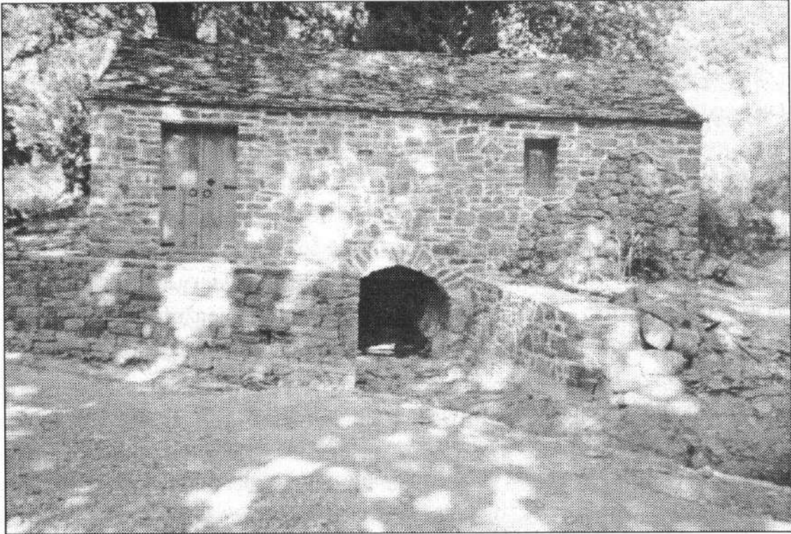
Ο νερόμυλος του Αβάσου (αναπαλαιωμένος) στο Κάτω Κοτσανόπουλο Πρέβεζας

τες σε σπλιά, και καμαρώνοντας ένας γύρω του τα σεγύρια οπού ήταν σκόρπια καταμεσής σαν να τα κατέβασε το ρέμα, είπαν δυσαρεστημένοι κοιτάζοντας το μυλωνά: “Ακαταστασία”. Εκείνος κατάλαβε και τους απάντησε: “Σαν στο μύλο αφεντάδες”.