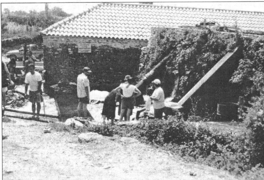
Μύλος - νεροτρουβιά στην Καμπή Φιλιππιάδας