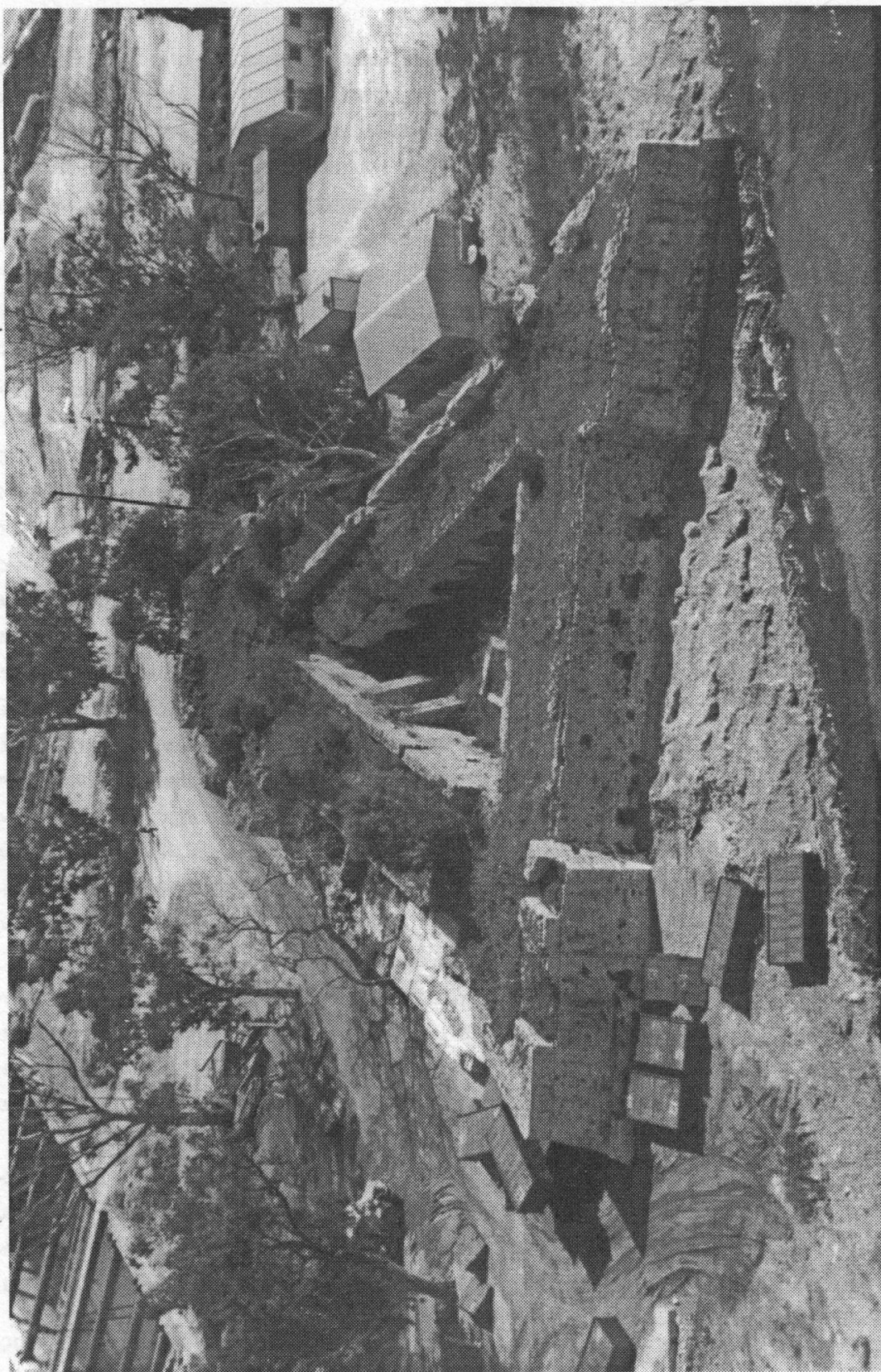
Το φρουάριο του Ακτίου που κτίστηκε το 1819 από τον Αλή Πασά.