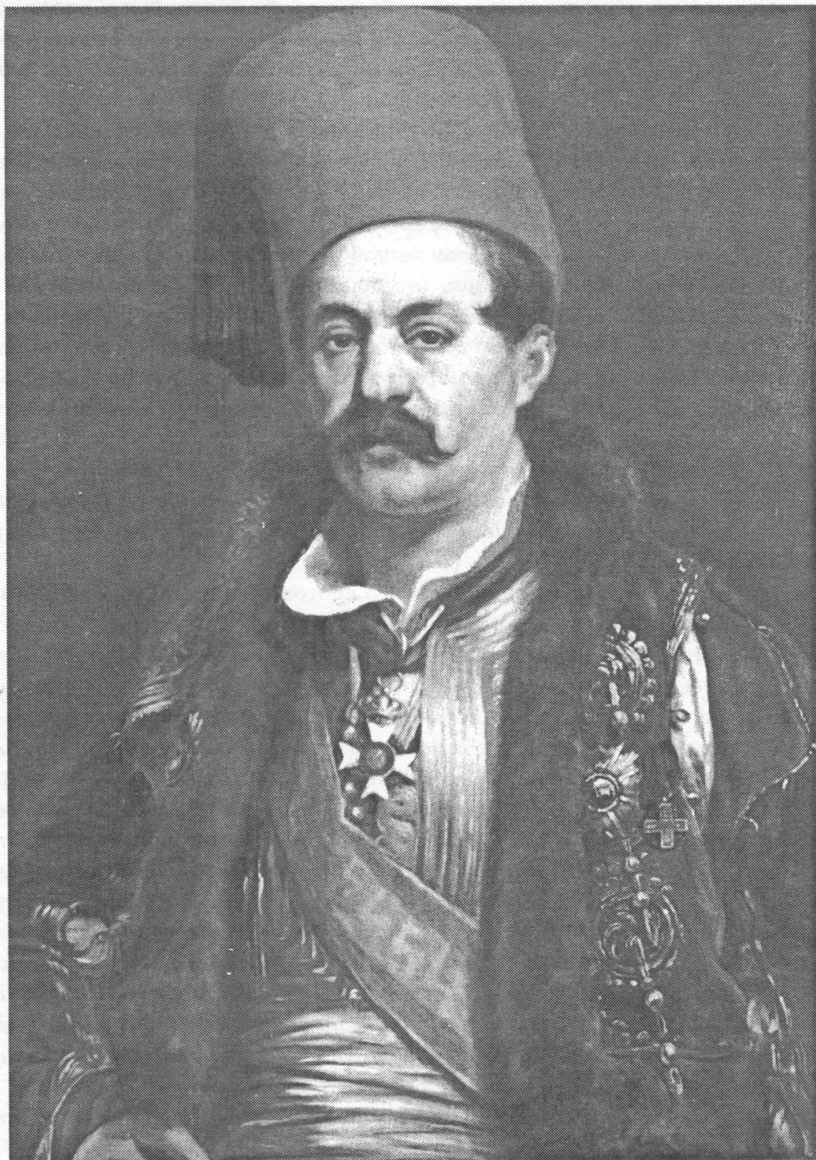
Ιωάννης Κωλέττης , ο πρώτος εκλεγμένος Πρωθυπουργός του ελεύθερου ελληνικού κράτους.

Ελαιογραφία. Εθνικό Ιστορικό Μουσείο, Αθήνα.