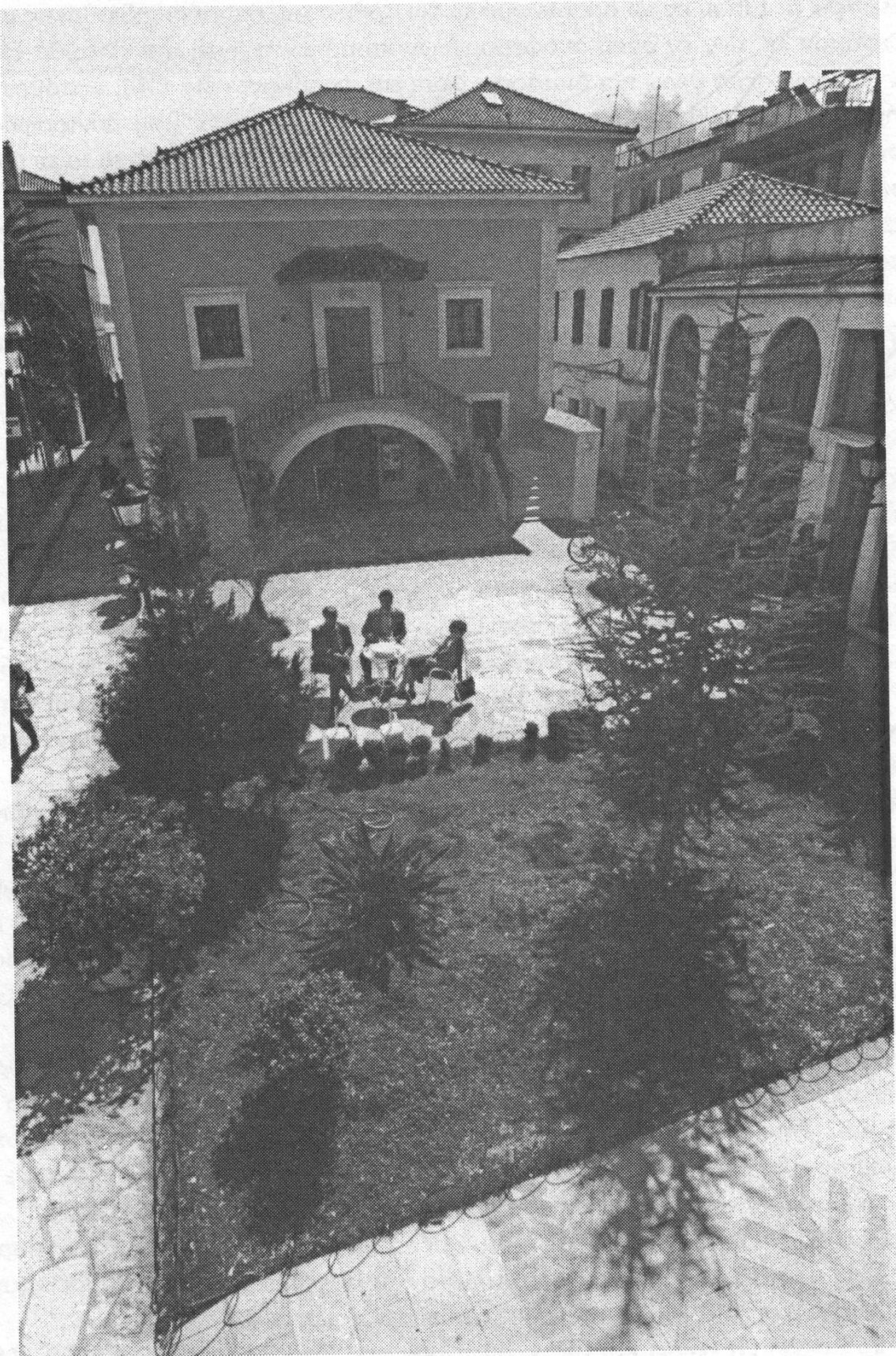
Η Θεοφάνειος Σχολή σήμερα