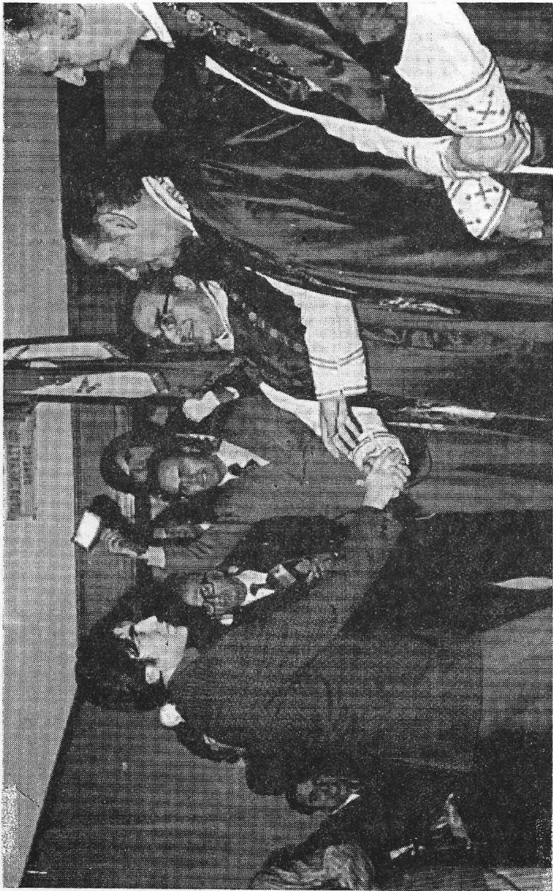
1973: Ο Πρύτανης Κωνσταντίνος Κονοφάγος κατά την ορκωμοσία φοιτητών του Ε.Μ. Πολυτεχνείου