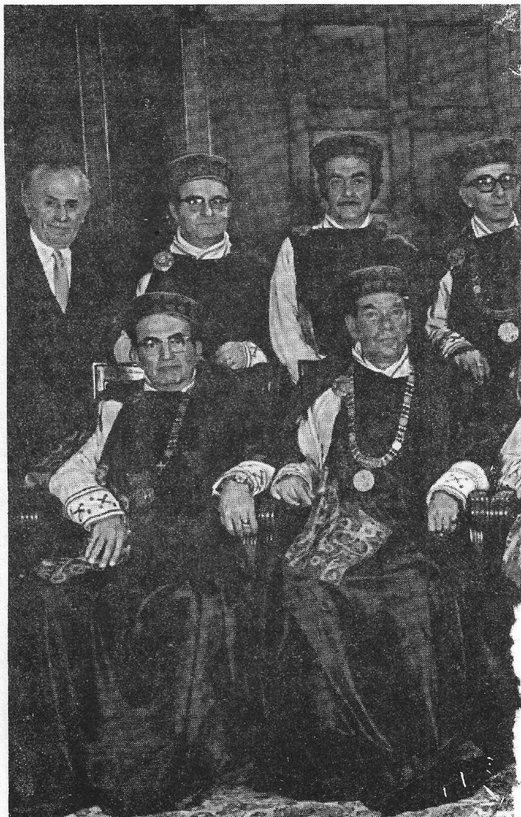
Ο Πρύτανης Κωνσταντίνος Κονοφάγος με τη Σύγκλητο του Ε.Μ. Πολυτεχνείου