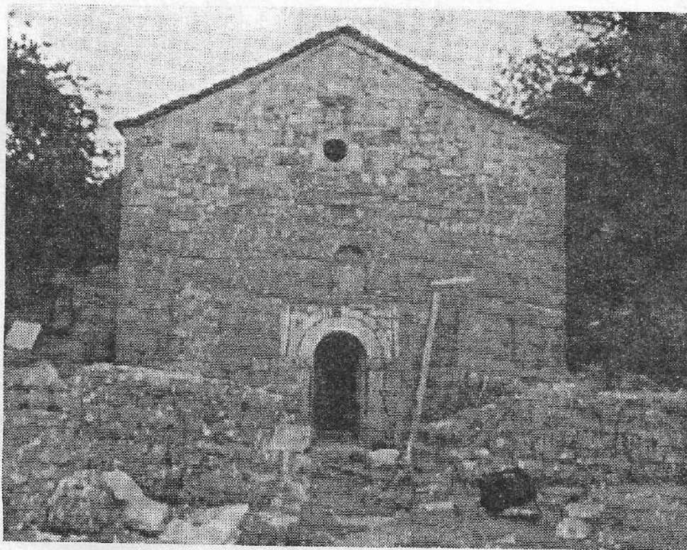
Το Καθολικό της Μονής του Ταξιάρχη και ο τάφος του Εθνομάρτυρα Ιερέα Μιχαήλ από την Καμαρίνα, όπως είναι σήμερα

Εμείς οι σημερινοί και αυριανοί Πρεβεζάνοι, απόγονοι εκείνων που με άπειρες θυσίες και απaráμιλλη ανδρεία αγωνίσθηκαν για να μας παραδόσουν Θρησκεία και Πατρίδα Ελεύθερη, ας είμαστε ευγνώμονες και υπερήφανοι συνάμα για τους αγώνες και τις θυσίες των Κληρικών και Λαϊκών και ας προσπαθήσουμε και εμείς να φανούμε αντάξιοι εκείνων όταν η Ορθόδοξη Εκκλησία μας και η Πατρίδα μας ζητήσουν τη συνδρομή μας!..