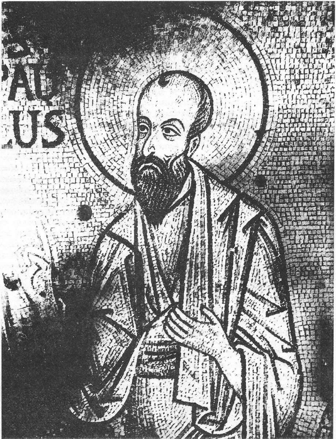
Ο απόστολος Παύλος κηρύττων - λεπτομέρεια από μωσαϊκό του 12ου αιώνα (Capella Palatina, Παλέρμο, Σικελία)