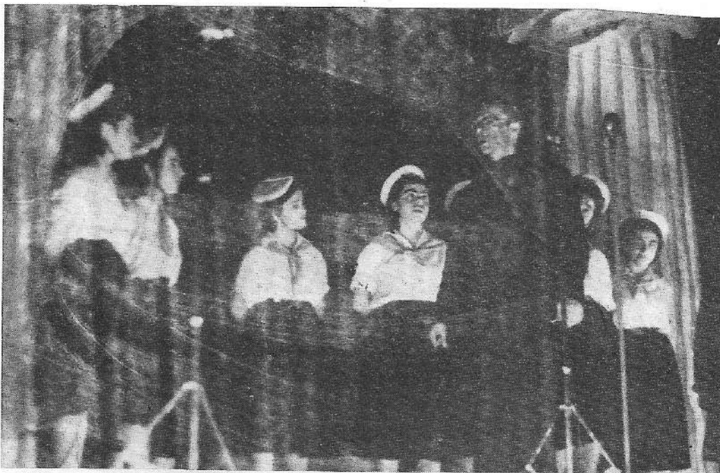
Από τη θεατρική παράσταση στα Γιάννενα, το 1951

Πρώτες και πάλι οι Οδηγοί στρωνόμαστε στη δουλειά: Στην Εκτία κάθε απόγευμα δουλεύουμε πυρετωδώς. Φπάχνουμε κουρελούδες, συγκεντρώνουμε ρουκισμό και είδη νοικοκυριού, ετοιμάζουμε όσο πιο πολλά δέματα μπορούμε και με τη βοήθεια της Μητρόπολης τα στέλνουμε στα νησιά μας.