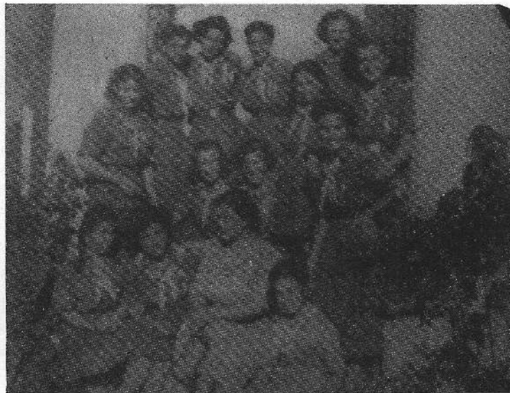
Κέρκυρα, καλοκαίρι 1950

Και η σκυτάλη δόθηκε κάποτε σε καινούργιες γενιές που θα έχουν να μιλήσουν για τις δικές τους εμπειρίες και το δικό τους έργο.