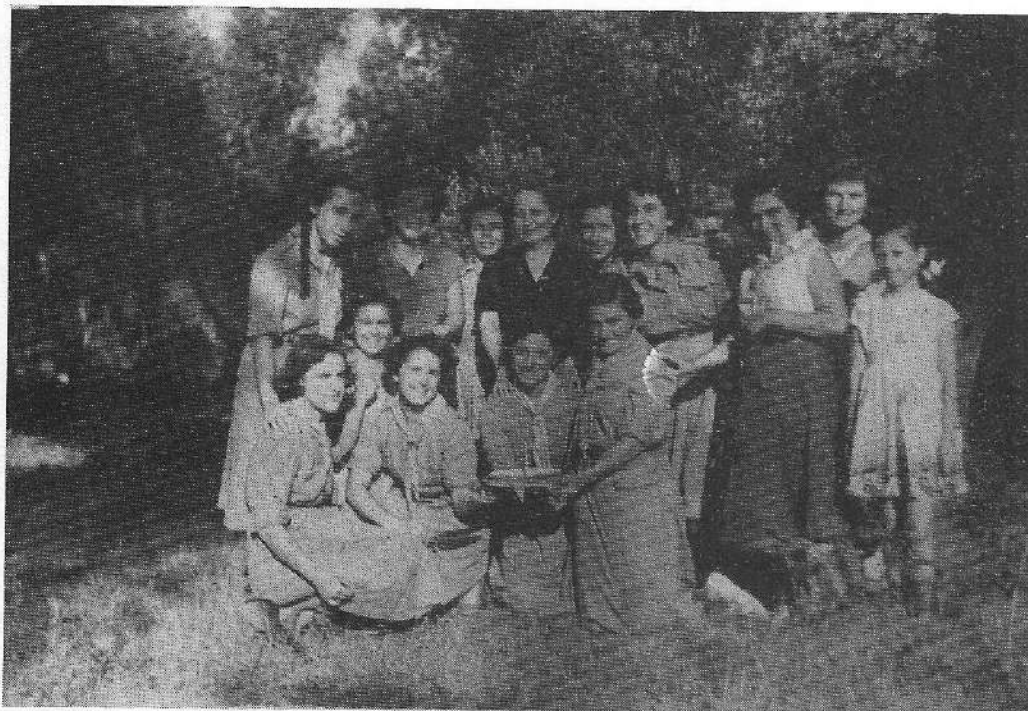
Μαργαρώνα 13-7-1952: Γενέθλια ομάδας Οδηγών

Γι' αυτή μας την προσφορά γίνεται πρόταση από το Διοικητή του Α' Σώμα-