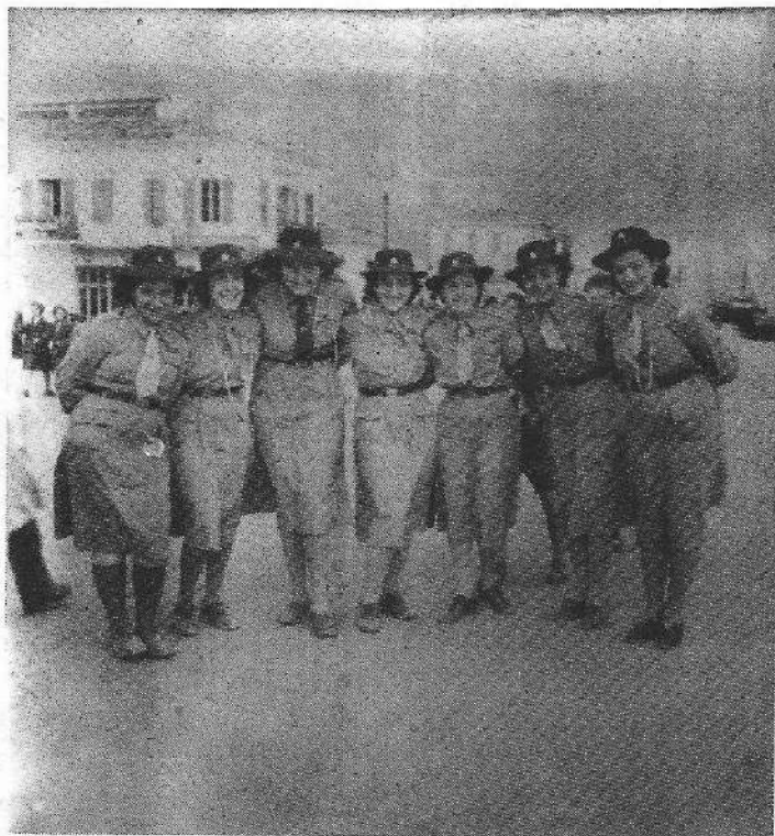
Μετά την παρέλαση της 25ης Μαρτίου 1953