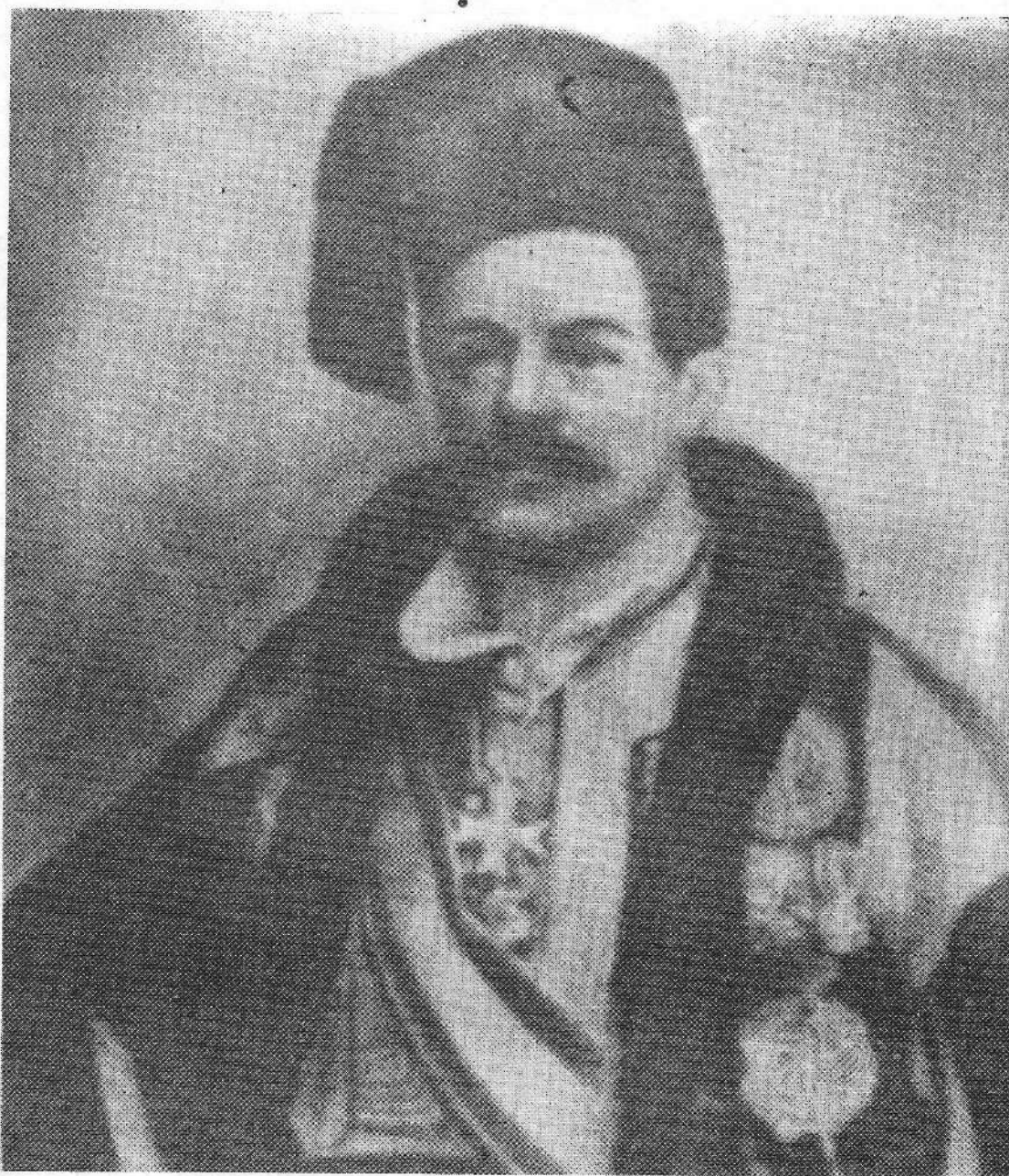
Ο Συρακιώτης πρώτος πρωθυπουργός της Ελλάδας Ιωάννης Κωλέττης

Από τις δυο αυτές σκάλες περνούσαν, δυο φορές κάθε χρόνο, οι Βλάχοι Ραφιάδες της Πίνδου.