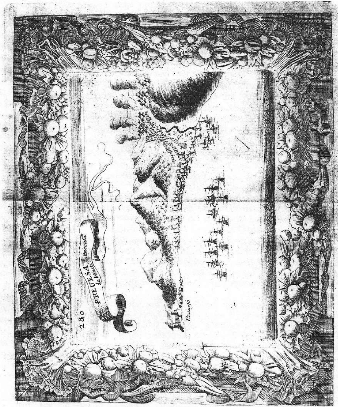
1691. Preveza under attack by the Venetians in 1684. Engraving by Coronelli and Locatelli.