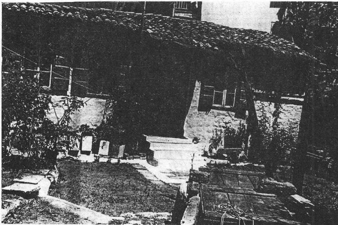
Παλιό σπίτι στην Πρέβεζα με πηγάδι που είναι κλεισμένο

Η συνέχεια της μπουγάδας και το πλύσιμο των χοντρών μεταφέρθηκε τώρα στα πηγάδια που ήταν κωμένα στις λουλουδιασμένες γραφικές αυλές. Γύρω από τα πη-