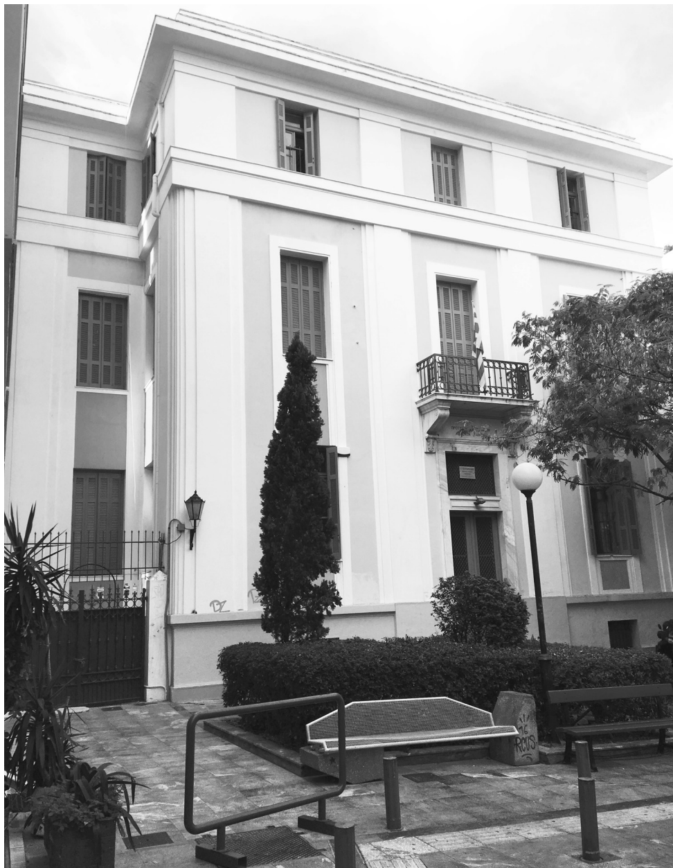
ΕΙΚΟΝΑ 2: Η οικία Πέτρου Ηπίτη στην Πλάκα, Αθήνα. Από το 1993 στεγάζει το 1ο Πειραματικό Λύκειο Αθηνών – Γεννάδειο, προς τιμήν του πρώτου του γυμνασιάρχη, Γ. Γενναδίου.