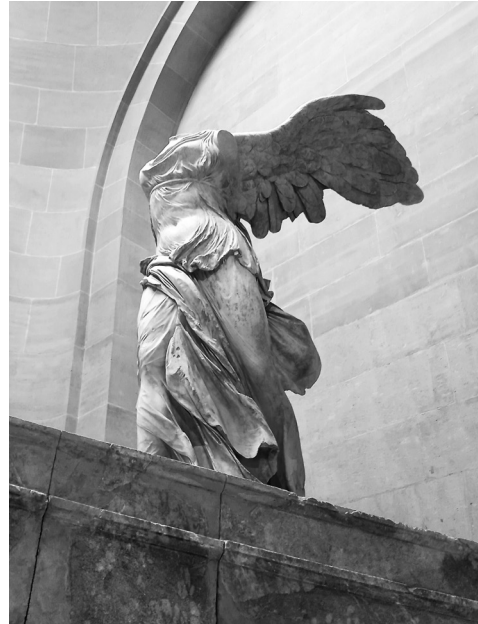
ΕΙΚΟΝΕΣ 3-4: (Αριστερά): Η Αφροδίτη της Μήλου στο Μουσείο του Λούβρου. (Δεξιά): Η Νίκη της Σαμοθράκης στο Μουσείο του Λούβρου. (Παρίσι 6 Νοεμβρίου 2021)

ευκαιρία για να ωφεληθεί προσωπικά και να αποκτήσει μια τεράστια συλλογή από αρχαιότητες, στρέφοντας το αμείωτο ενδιαφέρον του και την προσοχή του στα μνημεία της Ακρόπολης και κυρίως στον Παρθενώνα. Από το 1801 έως το 1804 τα συνεργεία του Έλγιν δρούσαν ανενόχλητα στην Ακρόπολη προκαλώντας σοβαρές ζημιές στα γλυπτά καθώς και στο υπόλοιπο μνημείο. Από τους 97 στο σύνολο σωζόμενους λίθους της ζωφόρου του Παρθενώνα, οι 56 βρίσκονται στο Λονδίνο και οι 40 στην Αθήνα. Από τις 28 σωζόμενες μορφές των αετωμάτων 19 βρίσκονται στο Λονδίνο και 9 στην Αθήνα. Να μην ξεχνάμε όμως ποτέ πως, όσο βέβαιο είναι το ότι μέρος της αρχαίας μας κληρονομιάς το δώσαμε προίκα στις Μεγάλες Δυνάμεις, άλλο τόσο σίγουρο είναι πως χρωστάμε την ύπαρξή μας ως κράτος χάρη στην ίδια την πολιτική των ξένων και στα δάνεια που χορηγούσαν διαρκώς, για να συντηρούν το κράτος-αποικία που λέγεται Ελλάδα για λόγους αυστηρά γεωπολιτικούς και όχι φιλελληνικούς.