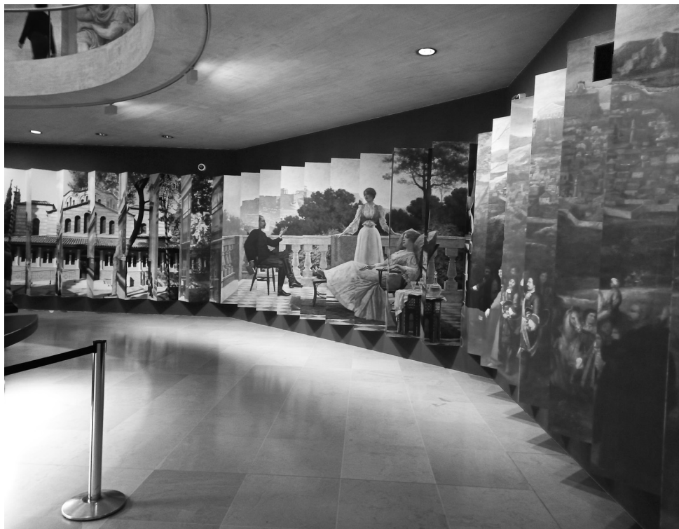
ΕΙΚΟΝΑ 2: Όψη εισόδου της έκθεσης «Παρίσι – Αθήνα (...)», στο Μουσείο του Λούβρου. (Παρίσι 6 Νοεμβρίου 2021, φωτογραφικό αρχείο Σπύρου Γ. Μπρίκου)

στέκει εκεί, αλλά θα στέκει εις τον αιώνα –της ανεξαρτησίας– τον άπαντα, καθώς, σύμφωνα με την αδιάψευστη λαϊκή ρήση, «ουδέν μονιμότερον του προσωρινού»!