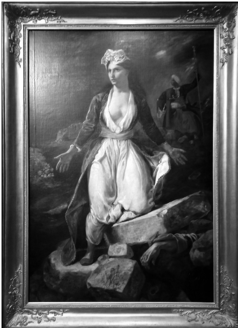
ΕΙΚΟΝΑ 7: «Η Ελλάδα στα ερείπια του Μεσολογγίου», του Ευγένιου Ντελακρουά, στο Μουσείο του Λούβρου. (Παρίσι 6 Νοεμβρίου 2021)