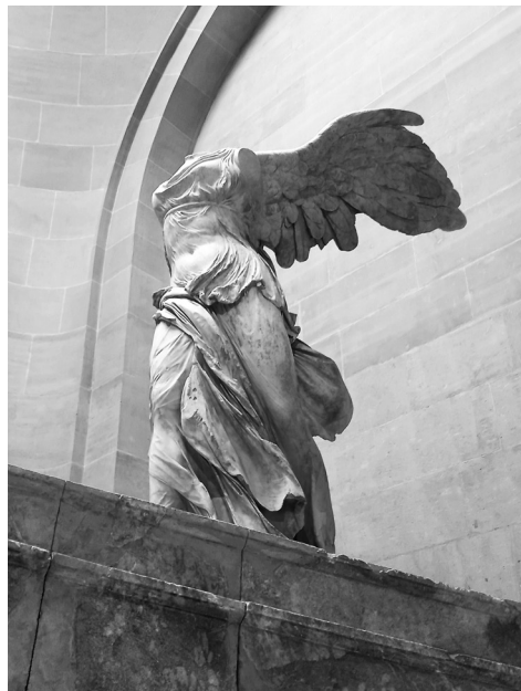
ΕΙΚΟΝΕΣ 3-4: (Αριστερά): Η Αφροδίτη της Μήλου στο Μουσείο του Λούβρου. (Δεξιά): Η Νίκη της Σαμοθράκης στο Μουσείο του Λούβρου. (Παρίσι 6 Νοεμβρίου 2021)

ευκαιρία για να ωφεληθεί προσωπικά και να αποκτήσει μια τεράστια συλλογή από αρχαιότητες, στρέφοντας το αμείωτο ενδιαφέρον του και την προσοχή του στα μνημεία της Ακρόπολης και κυρίως στον Παρθενώνα. Από το 1801 έως το 1804 τα συνεργεία του Έλγιν δρούσαν ανενόχλητα στην Ακρόπολη προκαλώντας σοβαρές ζημιές στα γλυπτά καθώς και στο υπόλοιπο μνημείο. Από τους 97 στο σύνολο σωζόμενους λίθους της ζωφόρου του Παρθενώνα, οι 56 βρίσκονται στο Λονδίνο και οι 40 στην Αθήνα. Από τις 28 σωζόμενες μορφές των αετωμάτων 19 βρίσκονται στο Λονδίνο και 9 στην Αθήνα. Να μην ξεχνάμε όμως ποτέ πως, όσο βέβαιο είναι το ότι μέρος της αρχαίας μας κληρονομιάς το δώσαμε προίκα στις Μεγάλες Δυνάμεις, άλλο τόσο σίγουρο είναι πως χρωστάμε την ύπαρξή μας ως κράτος χάρη στην ίδια την πολιτική των ξένων και στα δάνεια που χορηγούσαν διαρκώς, για να συντηρούν το κράτος-αποικία που λέγεται Ελλάδα για λόγους αυστηρά γεωπολιτικούς και όχι φιλελληνικούς.