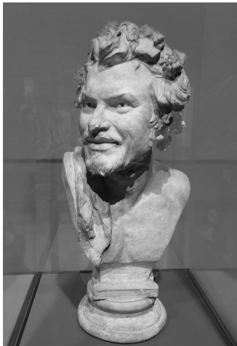
ΕΙΚΟΝΑ 5: «Κεφάλι Σατόρου» του Γιαννούλη Χαλεπά στο Μουσείο του Λούβρου. (Παρίσι 6 Νοεμβρίου 2021)

ση, συνεχιζόταν όσο παρατηρούσα και κατέγραφα λεπτομέρειες του περιεχομένου και της μορφής των θεματικών ενοτήτων και των εκθεμάτων. Χαρμολύπη, σαν σε ταύτιση με το διαγεγραμμένο μειδίαμα μιας προτομής του Γιαννούλη Χαλεπά με το κεφάλι Σατόρου και τη σκέψη να πηγαίνει σε εκείνη την αιώνια σύγκρουση που την αναδείξανε μοναδικά οι αρχαίοι Έλληνες και δεν είναι τίποτα άλλο από την αέναη αντίθεση μεταξύ απολλώνιου και διονυσιακού πνεύματος κατά την εξέλιξη των πολιτισμών. Πολλά ήταν εκείνα που τελικά ειπώθηκαν αιώνες πριν τη διαλεκτική του Χέγκελ. Η μήπως ήταν η ίδια η τρέλα, ο ψυχισμός του Χαλεπά, αποτυπωμένα στο πρόσωπο ενός δημιουργήματός του; Είναι και η επαναφορά στο μυαλό του συντάκτη του κειμένου αυτού όλης εκείνης της ανεπίσημης μα ζώσας «μικροϊστορίας» –που εύστοχα είχε ορίσει ο Γάλλος φιλόσοφος Μισέλ Φουκώ– του πολυπαθου εκείνου «πολιτισμικού τόπου» που λέγεται Ελλάδα, η οποία κάποτε ξεσηκώθηκε ενάντια στον κατακτητή: ...Και που πολέμησαν τον Τούρκο κατα-