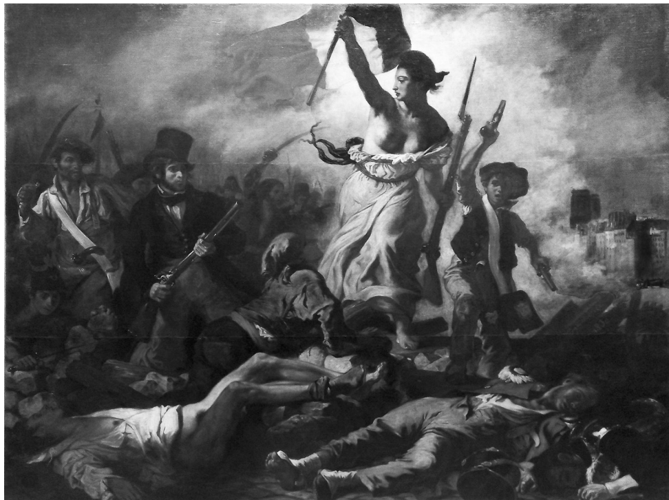
ΕΙΚΟΝΑ 8: «Η Ελευθερία οδηγεί τον λαό», του Ευγένιου Ντελακρουά, στο Μουσείο του Λούβρου. (Παρίσι 6 Νοεμβρίου 2021, φωτογραφικό αρχείο Σπύρου Γ. Μπρίκου)

προσωπεύει τις αξίες της Γαλλικής Επανάστασης: Ελευθερία, Ισότητα, Αδελφσύνη. Στο Πάνθεον του Παρισιού εμβληματικά είναι τα γυναικεία αγάλματα, το κεντρικό (με την επιγραφή: La Convention Nationale ) να κρατά σπαθί στο χέρι συμβολίζοντας την τρίτη κυβέρνηση της Γαλλικής Επανάστασης (τη Συμβατική Εθνοσυνέλευση), και τα άλλα γυναικεία γλυπτά και αγάλματα που παρουσιάζονται να προτάσσουν τα στήθη τους. Το Πάνθεον είναι φανερό πως λειτουργεί ως ένα μη θρησκευτικό μασωλείο, μιας και η τομή της Γαλλικής Επανάστασης ήταν τόσο βαθιά στο εποικοδόμημα, δηλαδή στους θεσμούς, τις αντιλήψεις και στις ιδέες της κοινωνίας, ώστε οι εθνικοί τους ήρωες (και σε αυτούς συμπεριλαμβάνονται οι επιστήμονες, οι συγγραφείς, οι φιλόσοφοι και όχι μόνο οι στρατηγοί) να μην «ανακατεύονται» με τη μεταφυσική και τα θρησκευτικά πιστεύω, πόσο μάλλον με τη θεσμοθετημένη θρησκευτική εξουσία που λύνει και δένει σε τριτοκοσμικά κράτη τύπου σύγχρονης Ελλάδας, όπως και αλλού!