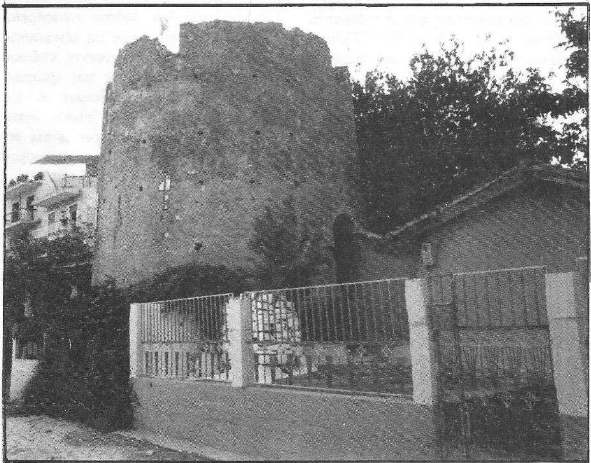
Ο ανεμόμυλος του 18ου αιώνα, στο Τσαβαλοχώρι

κατοίκους ήταν η παρακολούθηση της πορείας της σοδειάς από την ανθοφορία μέχρι το μάζεμα του καρπού και την απόδοσή του σε λάδι. Το ενδιαφέρον ήταν μεγάλο, γιατί από το "πιάσιμο" των ελαιοδένδρων στην ανθοφορία είχαν την πρώτη ένδειξη για τη σοδειά και κατά συνέπεια για την καλή ή κακή οικονομία του τόπου και όλοι εύχονταν να μην βάλει όστριες και κάψει τον ανθό. Τον Ιούλιο μήνα όταν ο καρπός μπορεί κάπως να εκμηθεύει, το πρωί, που ο ελαιόκαρπος φαίνεται καλύτερα, επισκέπτονταν τα ελαιοστάσια για να δούν τι καρπό έχουν και ευχόνταν να βάλει "λιοβόρια" γιατί ο θαλασσινός