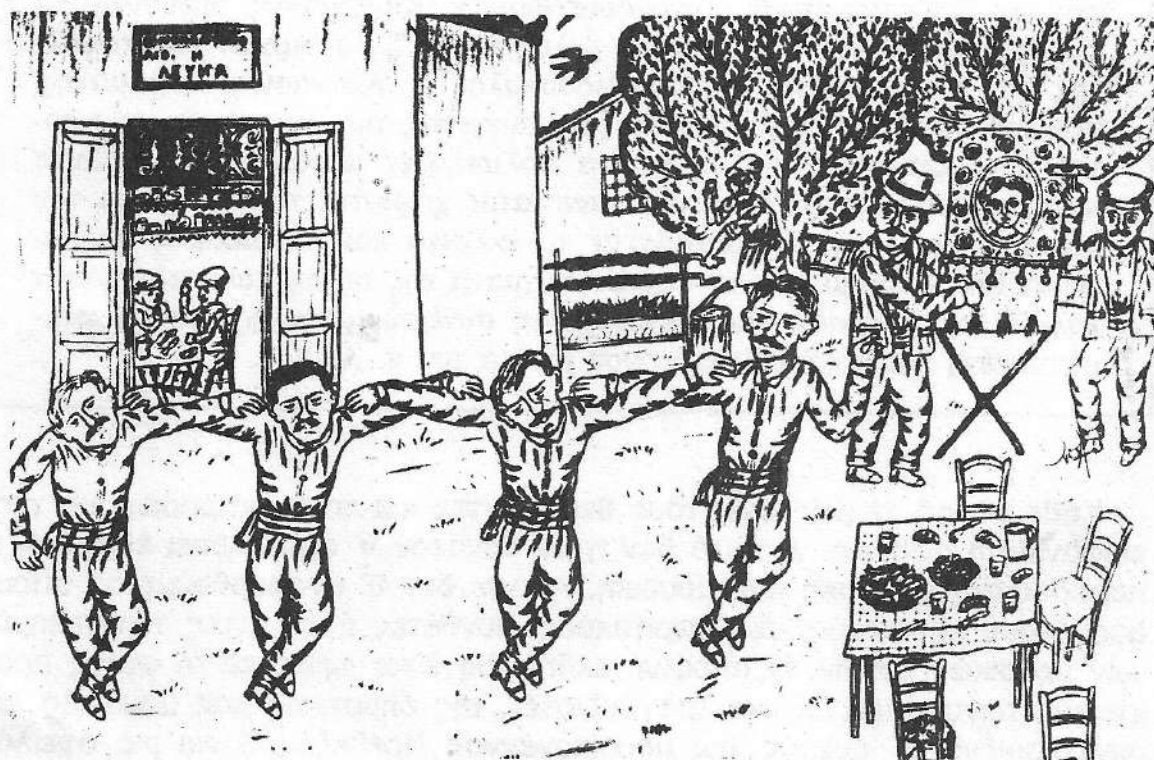
Προπολεμική ταβέρνα (Έργο Σταμ. Λαζάρου)

μουσικής. Καιρός ήταν. Όταν διοργανώνονται εκδηλώσεις και μεγάλες φιέστες αμφιβόλου αξίας και προσφοράς πολλές φορές, δημιουργώντας μάλιστα τεράστιες δαπάνες, ενώ το σύνολο του λαού τις παρακολουθεί μηχανικά και αδιάφορα ή και απέχει εντελώς, (που σε πολλές περιπτώσεις είναι και το καλύτερο) δεν είναι δίκαιο και ηθικά επιβεβλημένο να αφιερωθούν εκδηλώσεις σε θέματα (όπως το αποψινό), που αγγίζουν την ψυχή του λαού μας και άπτονται των στοιχείων της εθνικής μας ταυτότητας; Γι' αυτό η αποψινή εκδήλωση αποκτά μια ιδιαίτερη σημασία, ενώ ο δήμος, που τη διοργανώνει, αξίζει κάθε έπαινο. Τέλος είναι για μένα τιμητικό και άκρως συγκινητικό το γεγονός, ότι μου ανατέθηκε η παρουσίαση αυτής της μεγάλης και ιερής θα 'λεγα εκδήλωσης. Ας δούμε όμως σε μια γενικότερη και σύντομη αναφορά ποιό είναι οι πρακτικοί λαϊκοί οργανοπαίχτες και ποιό το έργο τους. Όπως οι ίδιες οι λέξεις μαρτυρούν, είναι πρακτικοί, εμπειρικοί, δεν είναι επιστημονικά καταρτισμένοι μουσικοί. Λέγονται λαϊκοί, γιατί εκφράζουν τη μουσική παράδοση του λαού. Και ποιά είναι αυτή το διαπιστώνουμε, όταν πάμε στα μεγάλα λαϊκά μας πανηγύρια. Στο σύνολό τους είναι άνθρωποι προικισμένοι με σπάνιο καλλιτεχνικό αισθητήριο, με οξύτατη αντίληψη και ακοή και απεριόριστη μνήμη. Διαθέτουν μια αξιοθαύμαστη διαίσθηση, που τους βοηθάει να ανακαλύπτουν κάθε ένδειξη της λαϊκής ευαισθησίας, να την αξιολογούν, να την εμπλουτίζουν, να της δίνουν μορφή, να την κάνουν μουσική, τραγούδι, χορό και να την