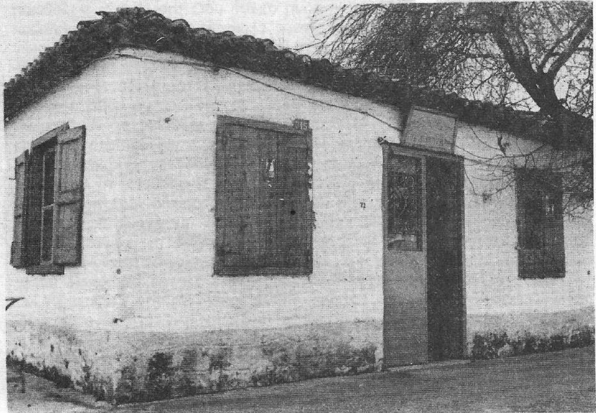
Το καφενείο του Σαούγκου που αποτέλεσε κέντρο αναφοράς για όλους τους Συρρακιώτες

επιθετική όψη, η επιθυμία δηλαδή της συρρακιώτικης οικογένειας να προγραμματίσει την έξοδο των αρσενικών μελών της από τους παραδοσιακούς επαγγελματικούς ρόλους (κιρατζής και κυρίως τυροκόμος). Όνειρο είχαν το «κεραμίδι», το αστικό επάγγελμα (ράφτης, τσαρουχάς, τσαγγάρης), που θα τους απάλλαζε από την αβεβαιότητα.