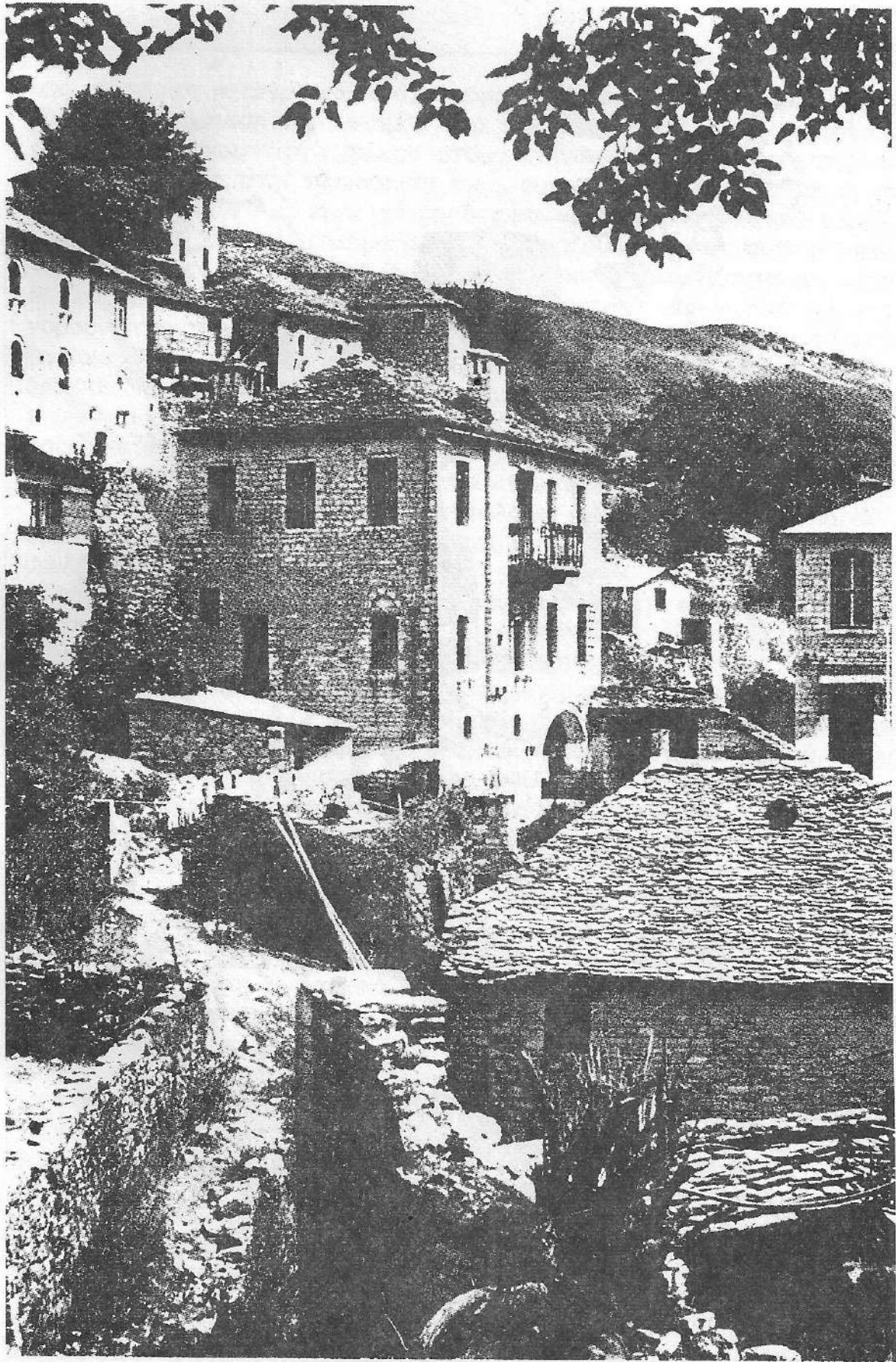
Άποψη του Συρράκου