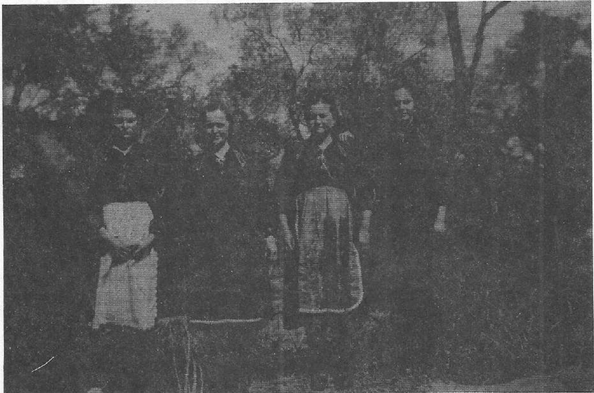
Νεαρές Συρρακιώτισσες ντυμένες με τη γιορτινή τους φορεσιά

(31) P.Mayer, « Migracy and the Study of Africans in Towns », American Anthropologist , 64 (1962), σ.590.