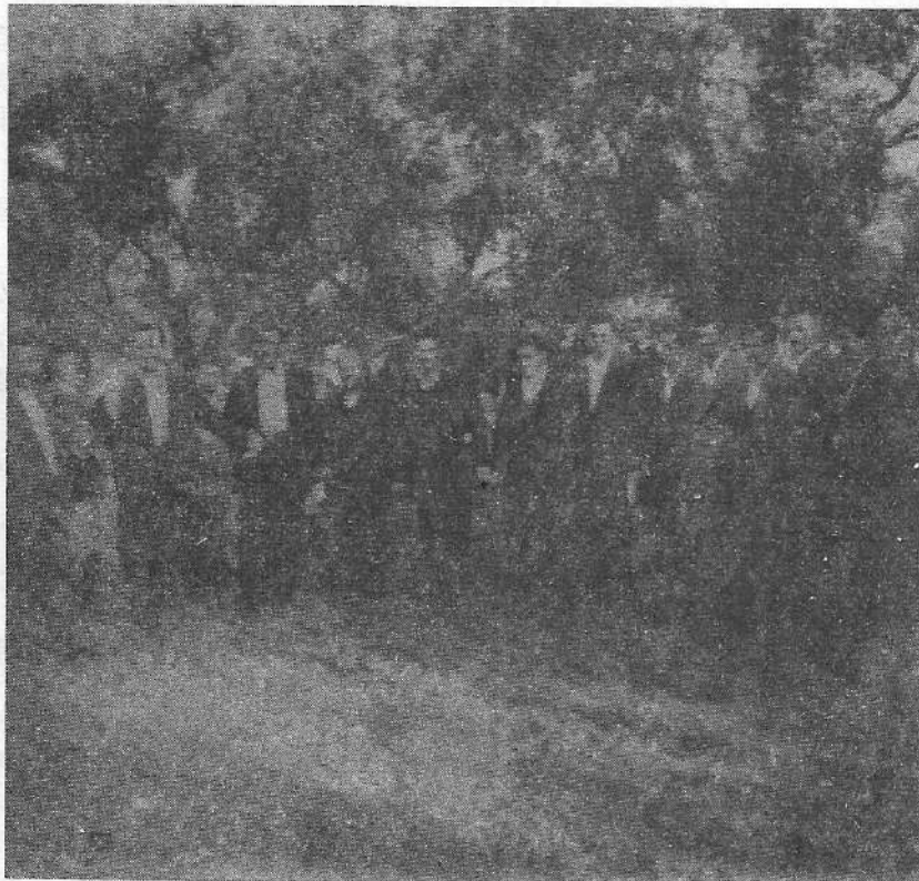
Πανηγύρι Συρρακιωτών στην Αγία Φανερωμένη