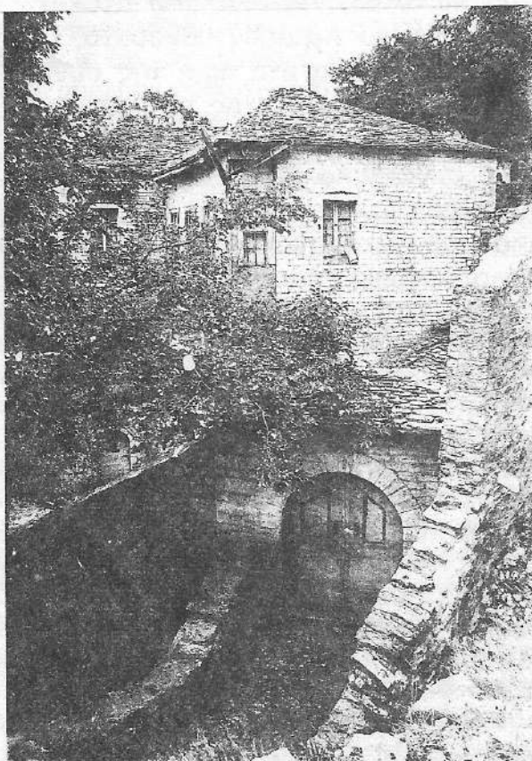
Αρχοντικό στο Συρράκιο

Στη συνοχή της κοινότητας συντέλεσε και ο Σύνδεσμος Συρρακιωτών Πρέβεζας. Για τους συλλόγους θα μπορούσε να πει πολλά κανείς.(47) Εκείνο πάντως που έχει σημασία είναι ότι εμφανίζεται σε μια εποχή που τα μέλη της κοινότητας έχουν βελτιώσει τη θέση τους μέσω της τοματοκαλλιέργειας, στην οποία στράφηκαν, και νιώθουν πλέον κάτοικοι της Πρέβεζας. Να ποιοί είναι οι σκοποί του Συνδέσμου: «α. Η συνεργασία, αλληλεγγύη και η σύσφιξις των σχέσεων μεταξύ των κατοικούντων εν τω νομώ Πρεβέζης καταγομένων εκ της κοινότητος Συρράκου. β. Η μέριμνα δια την πνευματικήν και οικονομικήν πρόοδον των εκ του Συρράκου καταγομένων και εν των νομώ Πρεβέζης κατοικούντων. γ. Η παροχή ηθικής και υλικής βοήθειας εις τους πάσχοντας και απόρους εκ Συρράκου καταγομένους και εν των νομώ Πρεβέζης κατοικούντας. δ. Η προικοδότησις απόρων κορασιδών καταγομένων εκ Συρράκου και εν τω νομώ Πρεβέζης κατοικούντων. ε. Η μέριμνα δια την επίλυσιν των προβλημάτων των αναφερομένων εις την πνευματικήν, εκπολιτιστικήν και μορφωτικήν πρόοδον και ανάπτυξιν της κοινότητος Συρράκου και των κατοίκων της. στ. Η μέριμνα δια την ανάπτυξιν των πλουτοπαραγωγικών πηγών της κοινότητος Συρράκου ήτοι γεωργίας, κτηνοτροφίας κ.λπ. ζ. Η παροχή βοήθειας και οικονομικής ενισχύσεως εις τέκνα απόρων Συρρακιωτών, ιδία δια την μόρφωσιν και προικοδότησιν τούτων. η. Η συνεργασία και η ανάπτυξις σχέσεων μεταξύ του Συνδέσμου και των άλλων σωματείων Συρρακιωτών έχόντων έδραν εις άλλους νόμους».