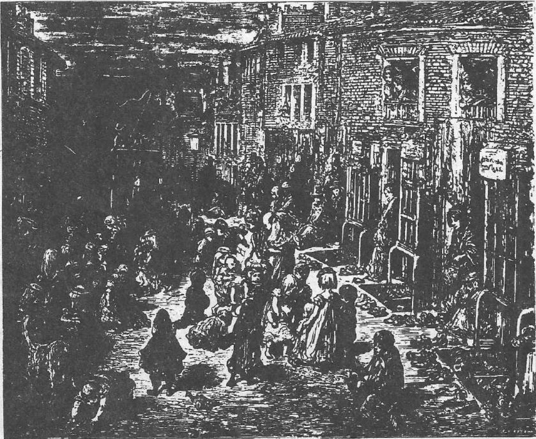
Slums στο Λονδίνο του 18ου αιώνα

(20) Άλκης Κυριακίδου-Νέστορας, «Η οργάνωση του χώρου στον παραδοσιακό