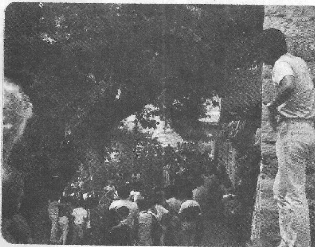
Πανηγύρι στο Συρράκο το Δεκαπενταύγουστο

νονται εκδηλώσεις(57). Από την άλλη εκείνοι που ζητούν σεβασμό στην παράδοση(58) του χωριού (πανηγύρι, σεμνότητα στην ενδυμασία και στη γενικότερη συμπεριφορά), που απειλείται από τους κατοίκους των πό-