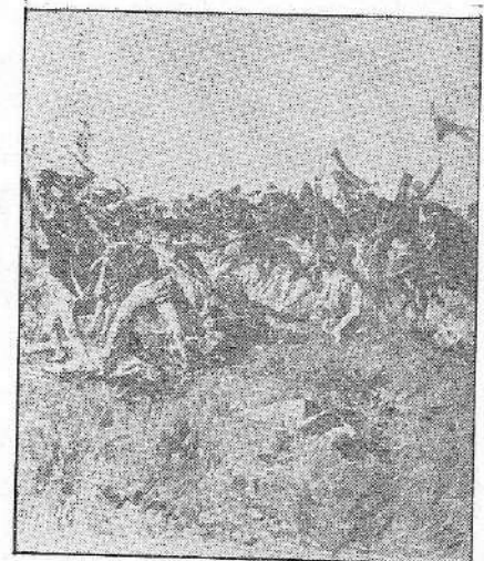
Από τη μάχη της Νικόπολης «Ηπειρωτική Εστία 1955»

Η επιθυμία του να κυριεύση την Πάργαν δεν απέβλεπε παρά να αφαιρέση διόλου την δύναμιν και ελπίδα των Σουλιωτών συνισταμένην ανέκαθεν εις την ύπαρξιν της Πάργας και Πρεβέζης, παρ' ων ελάμβανον πάντοτε πολεμοφόδια, εδώδιμα και παν άλλο αναγκαίον επί πολέμου και ειρήνης· η ταχεία όμως ένωσις των Σουλιωτών μετά των Παργίων, ως εν τω δευτέρω τόμω ρηθήσεται, και η μεθ' ημέρας επτά του ρωσοθω-