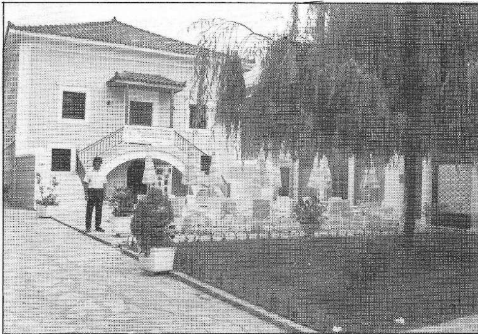
Η Θεοφάνεια Σχολή όπως είναι σήμερα.

5. Από το ΛΟΓΙΣΤΙΚΟ του Θεοφ. Κλ/τος βγαίνει ότι μέχρι τον Απρίλη του 1866 έπαιρνε 562.20 γρ. το μήνα. Τον Απρίλη του 1866 πήρε 568:30 γρ. από δε το Μάη του 1866 μέχρι το Σεπτέμβρη του 1875 πήρε 625 γρ. Από 1/9/75 ο μηνιαίος μισθός του γίνεται 791:26 γρ. Πολλές φορές, από έλλειψη πόρων, τον άφηναν μήνες πολλούς απλήρωτο. Για να μη χάνει τους τόκος των χρημάτων του, έκαναν Γραμμάτιο δανειστικό. Τον Ιούλιο του 1885, του υπέγραψαν γραμμάτιο. Μετά μείωσαν το μ. μισθό του σε 681 γρόσια το μήνα. Στη στήλη του «Δούνα» σελ. 446, γρόσια, που του χρωστούσαν από μισθούς. Είναι αυτά, που με τη Διαθήκη του το 1893 έκαμε δώρο στην προσφιλή του Θεοφ. Σχολή, για την οποία διέθεσε όλη του τη ζωή.