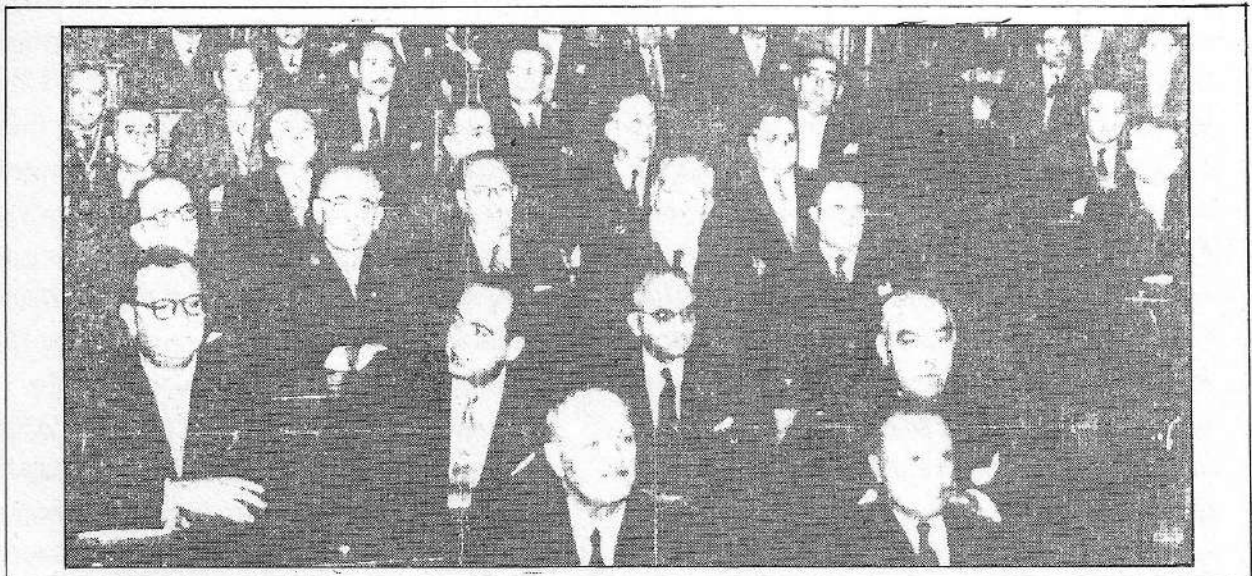
Οι Φιλελεύθεροι στη Βουλή. Στην πρώτη σειρά ο αρχηγός Σοφοκλής Βενιζέλος, και ο Θ. Χαβίνης, ο οποίος τότε ήταν σ' ανάρρωση μετά από εγχείρηση προστάτη.

Την δυσκολία αυτή του Εθνικού Κόμματος την εκμεταλλεύτηκε ο ξένος προς τον τόπο, δικηγόρος και έφεδρος λοχαγός από την Πελοπόννησο, Γιάννης Φωτόπουλος, ο οποίος στην Κατοχή πήγε στο Ν. Ζέρβα και κατάφερε να γίνει Δ/τής ενός