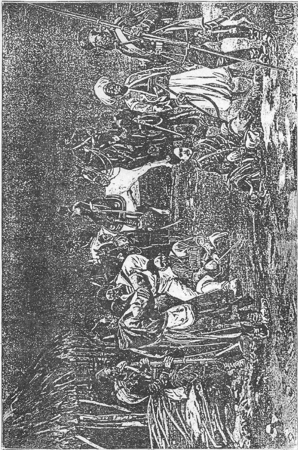
Τα Τουρκικά στρατεύματα