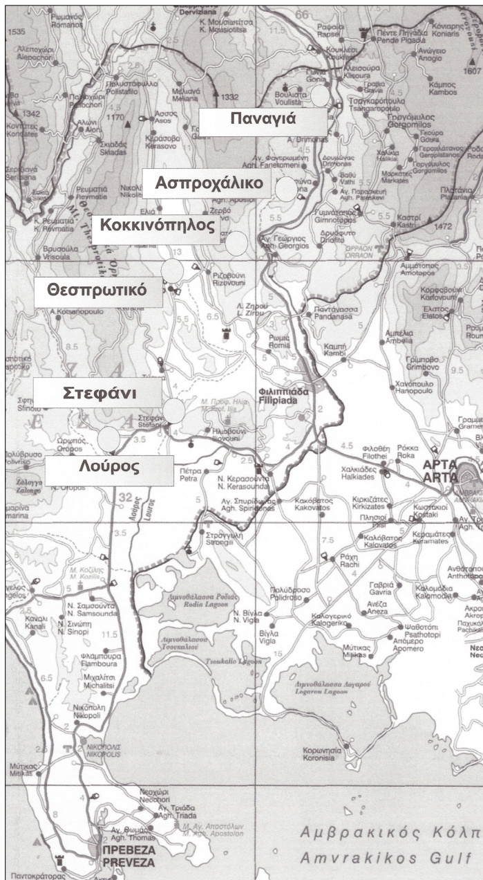
ΕΙΚΟΝΑ 4: Χάρτης στον οποίον παρουσιάζονται οι παλαιολιθικές θέσεις παραπλεύρως του ποταμού Λούρου