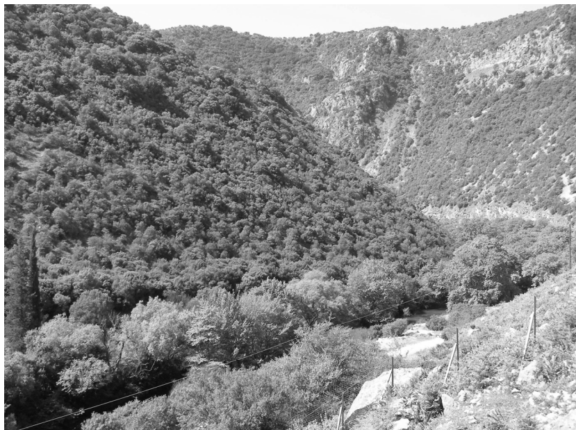
ΕΙΚΟΝΑ 3: Η κοιλάδα του ποταμού Λούρου παραπλεύρως της βραχοσκεπής

φος και νερό από τον παρακείμενο ποταμό Λούρο. Αυτοί οι λόγοι οδήγησαν καταρχήν στο συμπέρασμα ότι η βραχοσκεπή κατοικούνταν μόνο κατά τους θερινούς μήνες. Όμως αυτό είναι ένα ερώτημα αφού ο περιβάλλον χώρος, είτε οι ορεινοί όγκοι, είτε ο ποταμός, παρείχε αφθονία τροφής σε όλες τις εποχές. Η εύρεση οστών ζώων αποδεικνύει την ικανότητα του ανθρώπου να κυνηγά ζώα από την ευρύτερη περιοχή και έχουν ταυτιστεί με ελαφοειδή, αιγοπροβατοειδή, βοοειδή, αλλά και ιπποειδή, αρκουδοειδή και ρινοκερωτίδες. 19