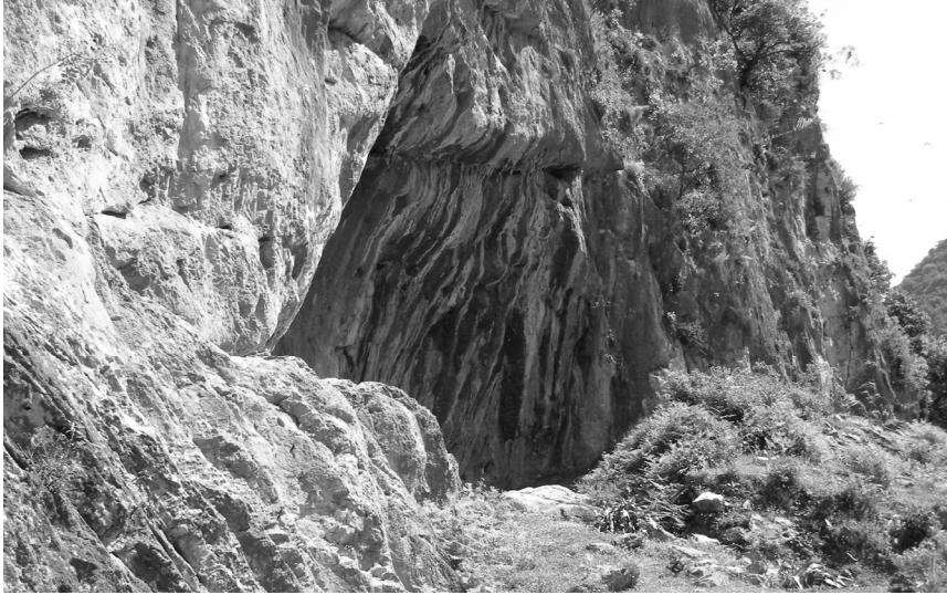
ΕΙΚΟΝΑ 2: Η βραχοσκεπή του Ασπροχάλικου