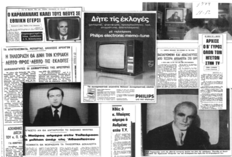
Εικόνα 2. Οι αναφορές του Τύπου για τον ρόλο της τηλεόρασης στις επερχόμενες εκλογές

Μολονότι οι εκλογές αποτελούσαν, έτσι κι αλλιώς, ένα συναρπαστικό γεγονός έπειτα από 10 χρόνια απουσίας δημοκρατικής ομαλότητας, πλέον απέκτησαν μια νέα παράμετρο, που τις έκανε ακόμη πιο ενδιαφέρουσες: την τροφοδότηση του λαού με εικόνες. Οι εκλογές γεγονός-βίωμα διαχωρίζονταν, έτσι, από την εικόνα που τις αποτύπωνε. Η ουσία και η αφήγηση, η πραγματικότητα και η εικόνα εξοικείωσαν με όρους ορατότητας τους ψηφοφόρους, οι οποίοι αντιμετώπιζαν πλέον τις εκλογές όχι μόνο ως επιβεβαίωση της δημοκρατίας αλλά και ως τηλεοπτικό γεγονός. Η μεταβολή πρόσληψης της έννοιας των εκλογών, ο νέος τρόπος που συμπληρώνεται το βίωμα, σε συνδυασμό με άλλες επιτελεστικές αλλαγές έπειθαν τους πολίτες για τη 'μετάβαση', η οποία ήταν δύσκολο να αμφισβητηθεί.