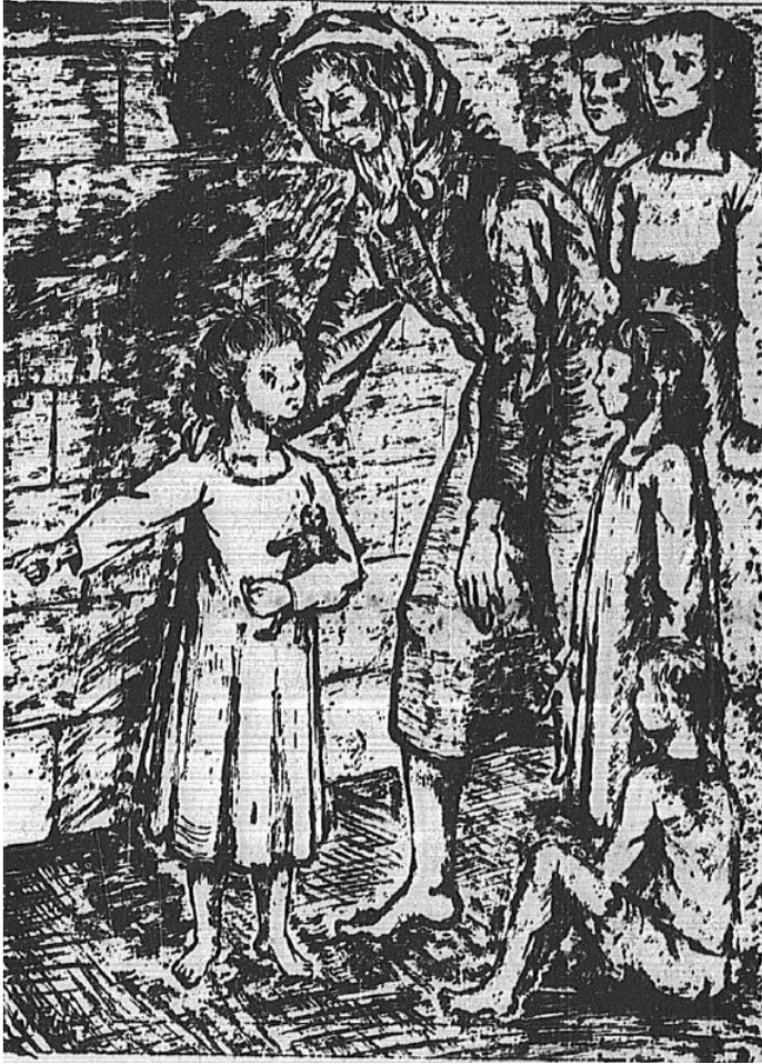
Εικόνα 5. Το έργο του André Graciès που κοσμεί το διήγημα «Τα Χριστούγεννα των παιδιών που δεν έχουν πια σπίτι»

Εκτός από αυτά τα δύο διηγήματα, η Αξιώτη γράφει επίσης κάποια άλλα αφηγήματα – στον ειδολογικό προσδιορισμό των κειμένων της θα επανέλθουμε στη συνέχεια. Στις 14 Μαΐου 1949, δημοσιεύει στην Humanité το κείμενο «Nos instants de joie» [Οι χαρούμενες στιγμές μας] (3).