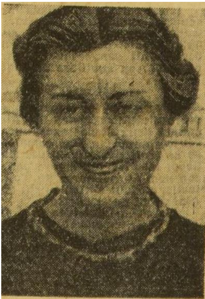
Εικόνα 7. Φωτογραφία της Αξιώτη που δημοσιεύεται επανειλημμένα στην L'Humanité της εποχής.

Τον Ιανουάριο του 1950, δημοσιεύεται πρωτοσέλιδο στο LF ένα κείμενό της, υπό μορφή επιστολής στην πολωνέζα και σοβιετική, όπως χαρακτηρίζεται συνήθως λόγω της παραμονής της στην ΕΣΣΔ μετά τον πόλεμο, συγγραφέα Wanda Wasilewska (Wassiliewska στο LF ), 31 σχετικά με το βιβλίο της Les ténèbres vaincues [Το σκοτάδι νικήθηκε, Gdy światło zarłonie , 1946], που είχε εκδοθεί το 1949 (αρ. 293, 5.1.1950, 1 και 3). Το βιβλίο μιλάει για έναν στρατιώτη που γυρίζει μετά τον πόλεμο στον τόπο του και δυσκολεύεται να προσαρμοστεί στη νέα του ζωή, αλλά τελικά βοηθάει την κοινότητα και η ζωή του αποκτά νόημα. Διαβάζοντας αυτό το βιβλίο για το τέλος του πολέμου και του σκότους και σχολιάζοντάς το θεματικά και υφολογικά, η Αξιώτη καταλήγει σε μια σύγκριση με την Ελλάδα, όπου το σκοτάδι συνεχίζει να βασιλεύει: