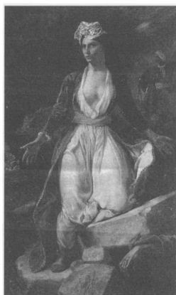
Ντελακρούά, Η Ελλάδα στα ερείπια του Μεσολογγίου

(στρ. 82) Και εσύ θάνατη, εσύ θεία, / που ό,τι θέλεις ημπορείς εις τον κάμπο, Ελευθερία, / ματωμένη περπατείς.