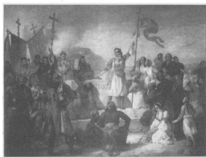
Λιπαρίνι, Ο όρκος του Λόρδου Βύρωνα στον τάφο του Μάρκου Μπότσαρη .