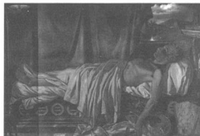
Οντεβέρ, Ο θάνατος του Βύρωνα

Η επίσκεψη του Βύρωνα στον τάφο του Μπότσαρη αναπαρίσταται στον πίνακα του Λουδοβίκου Λιπαρίνι Ο όρκος του Λόρδου Βύρωνα στον τάφο του Μάρκου Μπότσαρη , έργο το οποίο σήμερα βρίσκεται στο Δημοτικό Μουσείο (Museo Civico) του Τρεβίζο. Ο θάνατος του Μπότσαρη αποτέλεσε προσφιλές και επανερχόμενο θέμα για τους ευρωπαίους ζωγράφους. Ας θυμηθούμε το έργο του