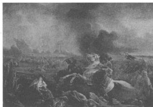
Λανγκλουά, Η επίθεση του Ιμπραήμ πασά εναντίον του Μεσολογγίου