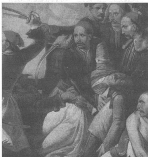
Ες, Ο Μάρκος Μπότσαρης στη μάχη του Καρπενησιού

Ο έπαινος του Μάρκου Μπότσαρη απαντάται και στο ποίημα του 1823 «Εις Μάρκο Μπότσαρη», στο οποίο η Δόξα, πλάι στον τάφο του ήρωα, κλαίει για το θάνατό του. Η ίδια μορφή, η οποία πενθεί τον Βύρωνα στο ποίημα «Εις το θάνατο του Λόρδου Μπαίρον», εμφανίζεται και σε αυτό το ποίημα. Η αναφορά στη λιμνοθάλασσα του Μεσολογγίου μπορεί να συνδεθεί επίσης με την πρώτη πολιορκία: