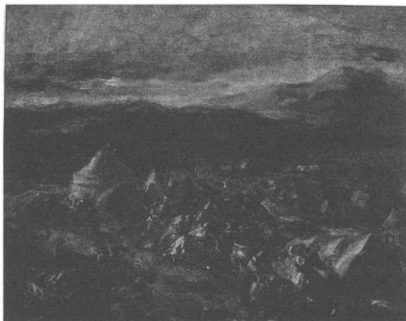
Ντελακρούα, Ο Μπότσαρης αιφνιδιάζει το στρατόπεδο των Τούρκων

Στο έργο αυτό, η ποικιλία και η δύναμη των χρωμάτων αντικαθιστά το σκιοφωτισμό στην απόδοση της εικόνας. Δεν έχουμε εδώ τη αυστηρή απεικόνιση των μορφών με εμμονή στην περιγραφή των λεπτομερειών του κάθε αφηγηματικού στοιχείου, η οποία οδηγεί σχεδόν αναπόφευκτα στο διασκορπισμό του περιεχομένου. Στο έργο αυτό παρατηρούμε ότι στο σχέδιο είναι εμφανές ένα σπάσιμο της γραμμής στα περιγράμματα, ενώ στο χρώμα είναι