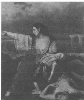
Ντελανσάκ, Επεισόδιο από την έξοδο του Μεσολογγίου ή Η Μεσολογγίτισσα