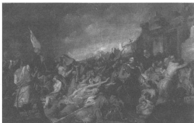
Ροσινιόν, Η τελευταία μετάληψη των Μεσολογγιτών

Η εικόνα του μωρού που θηλάζει συνδέεται άμεσα με τον πίνακα του γάλλου ζωγράφου Φρανσουά-Εμίλ Ντελανσάκ με τίτλο Επεισόδιο από την έξοδο του Μεσολογγίου ή Η Μεσολογγίτισσα (1828). Το έργο βρίσκεται σήμερα στη Δημοτική Πινακοθήκη του Μεσολογγίου. Ο ζωγράφος απεικονίζει τη νεαρή μάνα, η οποία έχει ήδη σκοτώσει το μωρό της και ετοιμάζεται να αυτοκτονήσει, προκειμένου να μην πέσει στα χέρια των Τούρκων. Η αυτοκτονία θα την απαλλάξει από μια ζωή ατίμωσης και σκλαβιάς. Στο βάθος του έργου, η παρουσία των αρχαίων ερειπίων υποδηλώνει την ιστορική επιταγή που σπλιίζει το χέρι