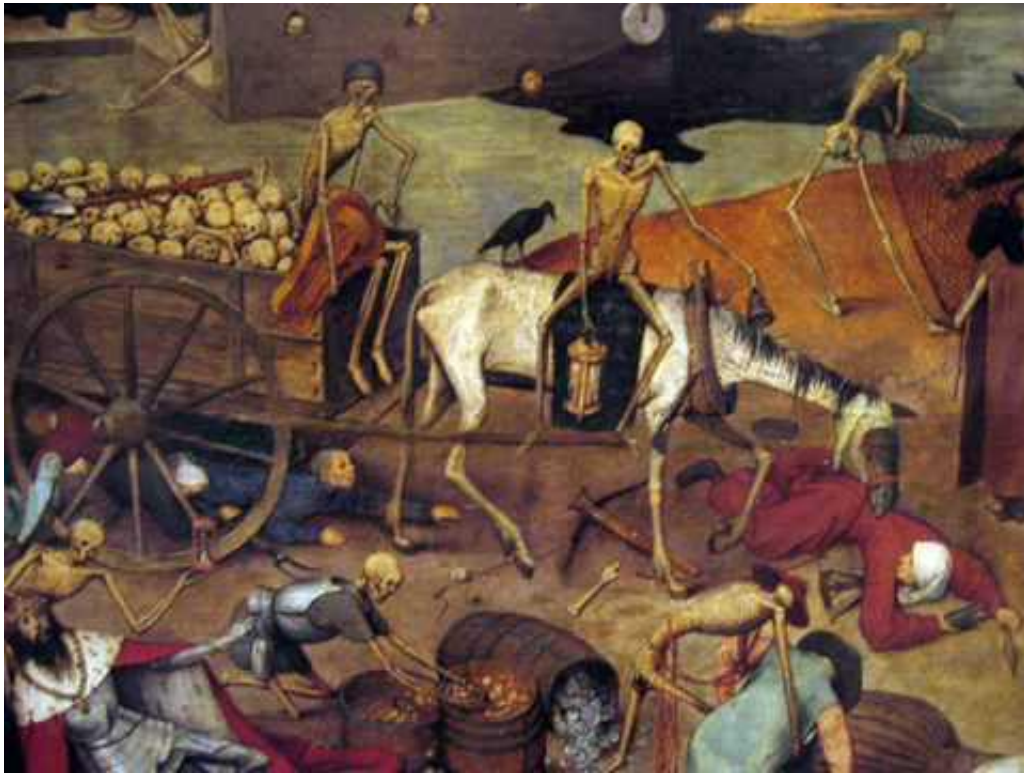
Εικόνα 10. Johannes Kastav, Χορός των νεκρών , Hrastovlje, Σλοβενία, 1490.