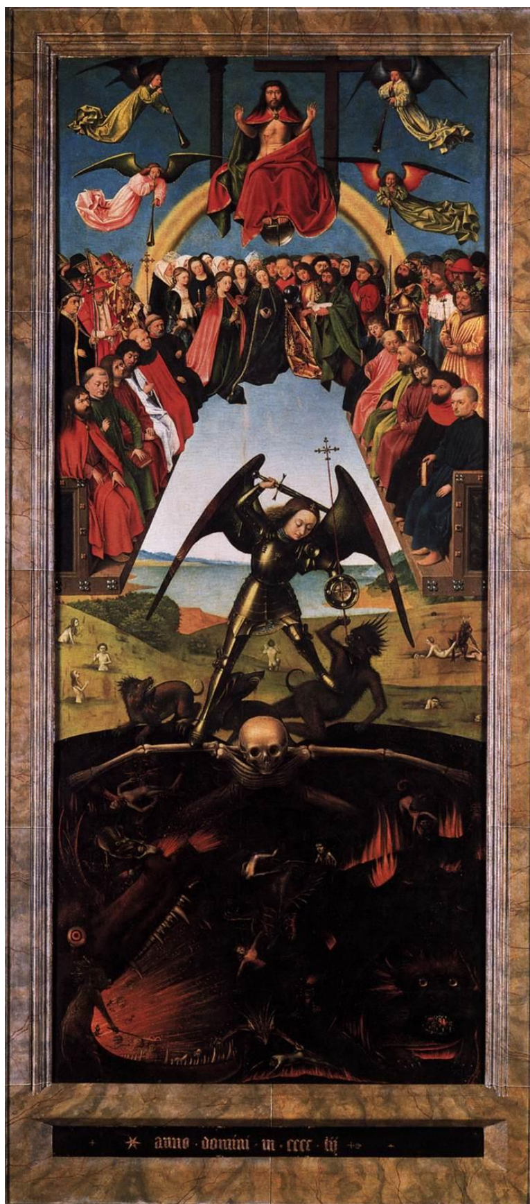
Petrus Christus, Δευτέρα Παρουσία, 1452.