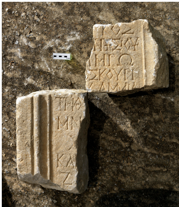
Fig. 1. Cipe funéraire d'Ammia.

ΞΤΟΥΣ ΞΤ ΤΟΡΚΟΣ ΔΙΟΝΥΣΙΟΥ ΚΑΙ ΜΡΩ ΔΙΟΣΚΟΥΡΙ ΔΟΥΑΜΜΙΑ ΤΗΟΥΓΑΤΡΙ ΜΝΗΜΕ ΧΑΡΙΝ ΚΑΙ ΞΑΥΤΟΙΣ ΖΩΝΤΕΣ